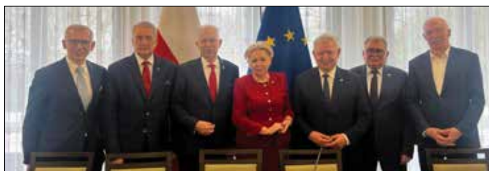
Członkowie Parlamentarnego Zespołu ds. Spółdzielczości

Ten bezprecedensowy Zespół, jak podano, ma na celu inicjowanie i wspieranie działań na rzecz rozwoju spółdzielni w Polsce, promowanie i upowszechnianie wiedzy o spółdzielczych formach gospodarowania, monitorowanie wprowadzonych w życie nowych regulacji prawnych dotyczących szeroko pojętej tematyki spółdzielczej,