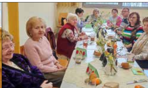
Spotkanie wielkanocne w klubie „Józefinka”