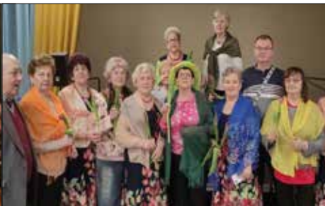
Dzień Kobiet i Dzień Mężczyzn razem świętowano w „Józefince”