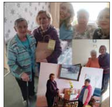
Świąteczne Niezbędniki Wielkanocne trafiły m.in. do mieszkańców Janowa

Niektórzy z Państwa przesłali nam swoje zdjęcia z Kina i informowali