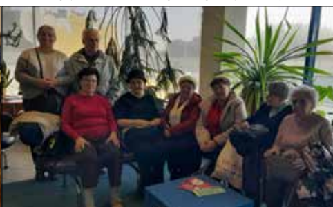
„Gwiazdowicze” w Bibliotece Śl. zapoznali się z książkami od najmniejszej do olbrzymiego tomu