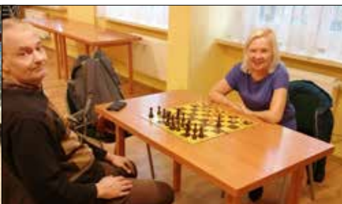
W niepokojne dni w klubie „Centrum” odbywają się rozgrywki szachowe, gier logicznych i brydżowe