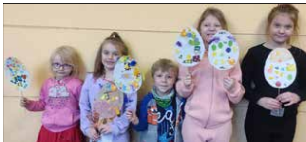
Dzieci prezentują wielkanocne ozdoby jako pokłosie zajęć plastycznych w „Józefince”

Dla Józefinkowych dzieci klub zorganizował tak lubiane przez nie zajęcia plastyczne. Tym razem zadanie było łatwe do przewidzenia – milusińscy mieli ozdobić jajka wielkanocne. Wyobraźnia dzieci nie zna granic i do wykonania zadania wykorzystywały różnego rodzaju materiały, takie