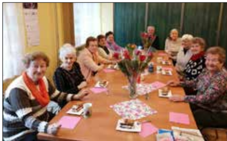
8 marca - Dzień Kobiet w klubie „Centrum”