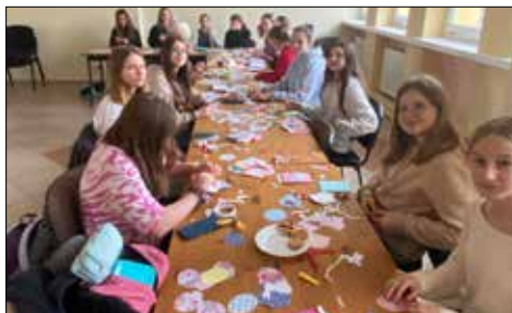
Młodzież robiła w GCK świąteczne kartki dla seniorów

„Juwenia” także postanowiła oprawić obchody Dnia Kobiet muzycznie. Jego celebrowanie więc rozpoczęła wizytą w Filharmonii Śląskiej, a tam polscy romantycy – Fryderyk Chopin oraz Stanisław Moniuszko wprowadzili klubowiczów w wyjątkowy nastrój, odpowiedni, by potem świętować Dzień Kobiet w klubie. Tu już miało ono