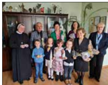
Podczas spotkania w Centrum Opiekuńczo-Wychowawczym „Wzrastanie”

789, osobiście w siedzibie Fundacji Da Moc przy ul. Klonowej 35C w Katowicach - pok. nr 15, zgłoszenia na adres pocztowy: Fundacja Da Moc 40-168 Katowice, ul. Klonowa 35C, zgłoszenia na adres e-mail: fundacja@ksm.katowice.pl