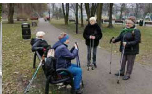
Klubowiczki z „Centrum” na spacerze w pobliskim Parku Budnioka

Kobiet to nie tylko zabawa, to również przypomnienie paniom, że nie należy zapominać o dbałości o siebie i swoje zdrowie, w tym o badaniach profilaktycznych.