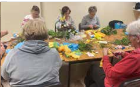
W Giszowieckim CK przeprowadzone zostały warsztaty robienia palm wielkanocnych dla seniorów...