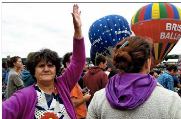
Na pokazie balonów w 2011 roku, w miejscowości Bristol w Anglii

– Który język według Pani sprawia najwięcej trudności Polakom? – Uważam, że bułgarski, ponieważ jest to język analityczny. Tam nie