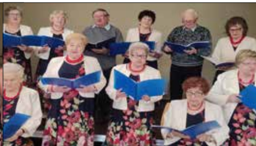
„Józefinki” śpiewały w swoim klubie podczas wspólnego Dnia Kobiet i Mężczyzn

„Marzec. Wracamy z parku. Wreszcie przeszła zima.