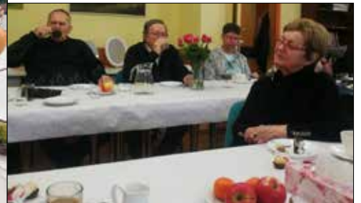
Spotkanie przedświąteczne w „Juwenii”