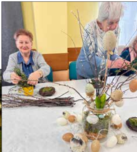
Podczas warsztatów florystycznych wykonywano w „Juwenii” ozdoby świąteczne

Seniorzy z Gwiazd wybrali się też w marcu do Biblioteki Śląskiej na warsztaty zatytułowane „Od miniaturowej książki do olbrzymiego tomu”. Biblioteka Śląska jest najstarszą księżnicą na Górnym Śląsku, uwzględniającą potrzeby środowisk akade-