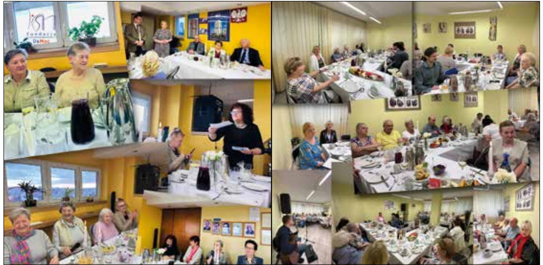
Na spotkaniu przedświątecznym w Haperowcu (z lewej) i w Śródmieściu

W maju planujemy kolejne spotkania. Skontaktuj się z nami, zapisz się i dołącz do naszych spotkań. Fundacja Da Moc – nr.: 660 416 987, 790 746