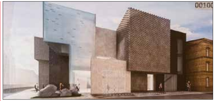
Centrum Himalaizmu im. Jerzego Kukuczki - wizualizacja

Ta bezpłatna jazda udostępniana będzie wszystkim zainteresowanym od 6 do 29 maja, zawsze od poniedziałku do piątku, w godz. od 8:00 do 16:00. Trasa na czas testowych jazd zostanie specjalnie oznakowana. Bus bez kierowcy będzie jeździł środkowym pasem jezdni, a boczne pasy służyć będą rolkarzom i rowerzystom.