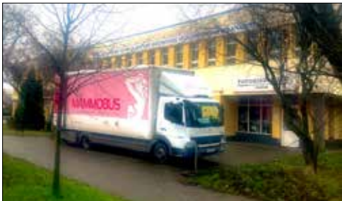
Mammobus na Giszowcu przy GCK

Kalendarz Świąt Nietypowych niemal każdego dnia w roku przyporządkowuje jakiegoś „bohatera”. W klubie „Trzynastka” postanowiono zaakcentować w marcowej działalności dwie propozycje. Obchodzono więc Dzień Puszystych, przypadający ponoć 1 marca. Z tej okazji „Trzy-