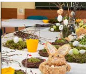
Plon warsztatów florystycznych w „Juwenii”