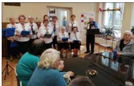
Gościnny występ „Alle Babek” w Domu Pomocy Społecznej