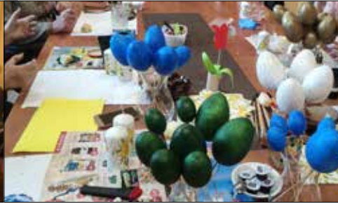
Różnorodne zdobienie jajek na zajęciach przedświątecznych w „Józefince”

nastka” zorganizowała spotkanie pół żartem pół serio poświęcone dzieciom - cud.