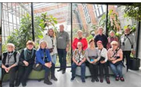
Klubowicze z „Juwenii” w sosnowieckim Egzotarium