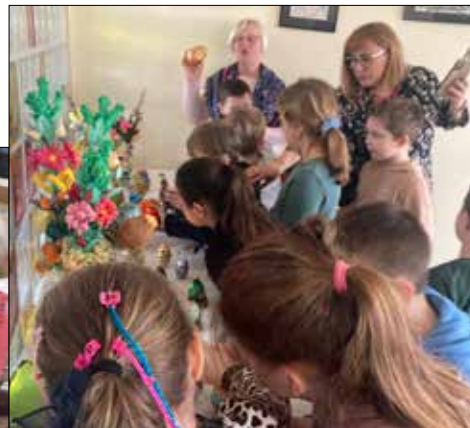
... i ozdób wielkanocnych dla dzieci