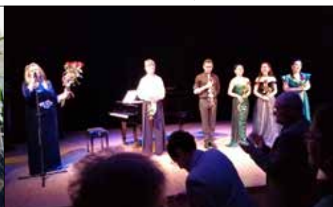
Z „Centrum” wybrano się na koncert arii operowych i operetkowych do MDK „Dqb”

malowane węglem i tuszem przedstawiające zarówno istniejące, jak też już nieistniejące: szyby kopalniane, domki i inne fragmenty architektury naszego regionu, to swoisty hołd złożony przez twórczynię bogatej kulturze i różnorodności krajobrazu naszego regionu. GCK serdecznie zaprasza wszystkich do zwiedzania.