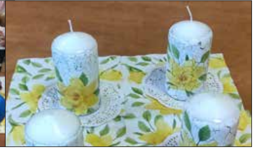
Kto chce nauczyć się zdobienia świec techniką dekupage winien zawitać do „Józefinki”

„Józefinka” także zajął się do tego wyjątkowego kalendarza i świętowała Międzynarodowy Dzień Pandy, organizując zajęcia plastyczne dla dzieci. Zadaniem milusińskich było stworzenie maski