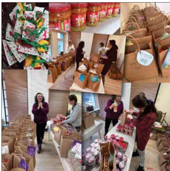
Fundacja Da Moc przygotowała Świąteczne Niezbędniki Wielkanocne

Święta Wielkanocne stały się kolejną okazją do przygotowania przez Fundację Da Moc i wręczenia mieszkańcom Katowickiej Spółdzielni Mieszkaniowej, wskazanym przez Rady Osiedlowe i administracje poszczególnych osiedli, tzw.