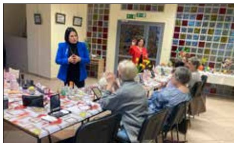
Spotkanie pielęgnacyjno-makijażowe dla pań w Giszowieckim Centrum Kultury

No i wiadomość last but not least: mieszkańcy spółdzielczych osiedli podczas swojego pierwszego wiosennego, marcowego wyjazdu zorganizowanego przez Dział Społeczno-Kulturalny KSM zwiedzili Pszczynę z jej słynnym „polskim Wersalem”, czyli Muzeum Zamkowym, podziwiając pełne przepychu, neobarokowe wnętrza. Pszczyński rynek zachwycił zwiedzających swoją urokliwą,