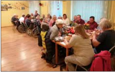
Nie jesteś sam przy wielkanocnym stole, w klubie „Centrum” spotkanie przedświąteczne osób z niepełnością ruchową