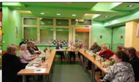
„Gwiazdy” - spotkanie seniorów