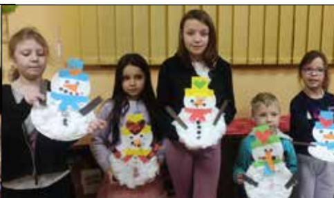
Zimowe wspomnienia – plon zajęć plastycznych dla dzieci w „Józefince”