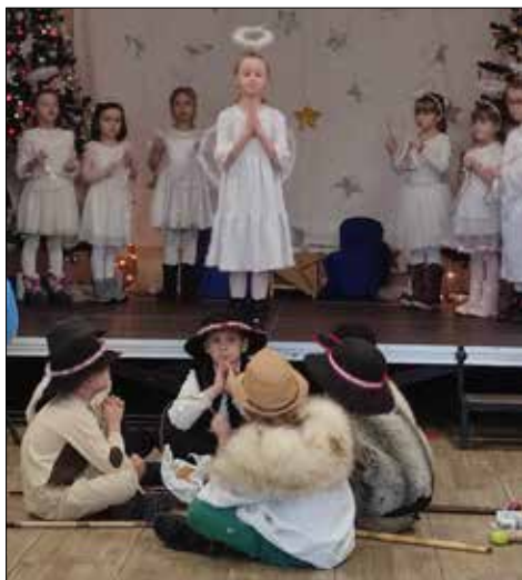
Jaseltka w „Józefince”

Zespół „Alle Babki” nie tylko umiał klubowe chwile, ale też niejednokrotnie dzielił się z innymi swoją radością związaną ze śpiewem. Panie wyruszyły z gościnnymi występami dla mieszkańców Katowic na zaproszenie do „Ministerstwa ds. Samotności”. – Nie chwaląc się „Alle Babki” wywołały swoim występem furorę. Grupa senierek z zespołu zaśpiewała dla