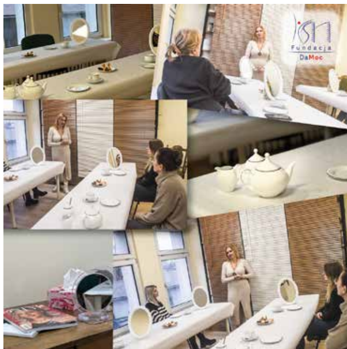
Tak wyglądały zajęcia kosmetyczne

W marcu, czyli już wkrótce świętujemy Dzień Kobiet . Zgodnie z tendencją równouprawnień, niedawno pojawił się tuż za nim także Dzień Mężczyzn . Ale to panie są bohaterkami naszego konkursu. Prosimy o podanie kim są damy na 8 portretach za-