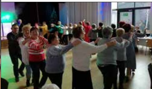
Klubowicze z „Centrum” na zabawie w MDK