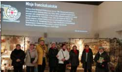
Klubowiczki z „Centrum” w Multimedialnym Muzeum Misyjnym