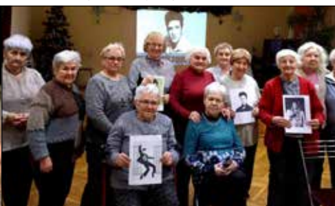
Seniorki z „Trzynastki” na wrywki znają życiorys Elvisa Przesleya