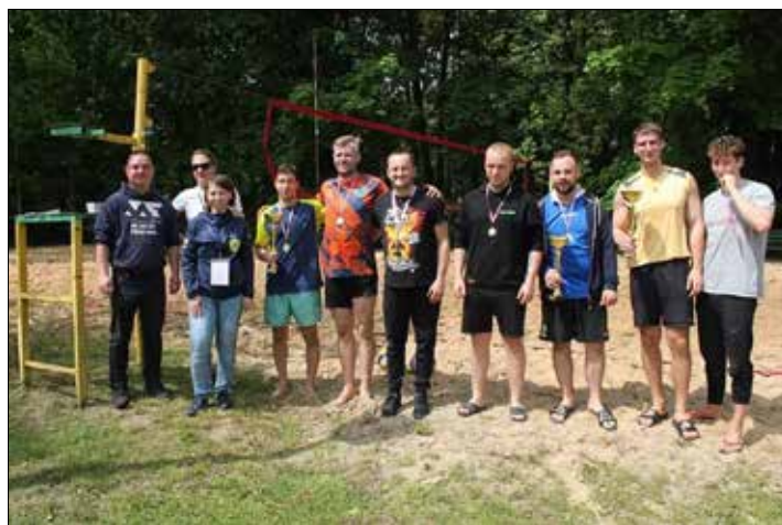
Z drużyną siatkówki plażowej

– No tak, marzy mi się, aby Rada Osiedla KSM „wyszła” do ludzi. Co przez to rozumiem? Chodzi mi o to, aby mieszkańcy dzielnicy Murcki czuli się tutaj dobrze, aby mieli świadomość tego, że o nich myślimy! O nich i ich potrzebach kulturalnych. Chcemy by mieli świadomość tego, że gdy po pracy mamy w rodzinach wolny czas, to żeby nie siedzieli w kapiach przed telewizorem, tylko przyszli na ciekawe imprezy organizowane przez osiedlowych społeczników, przez nas.