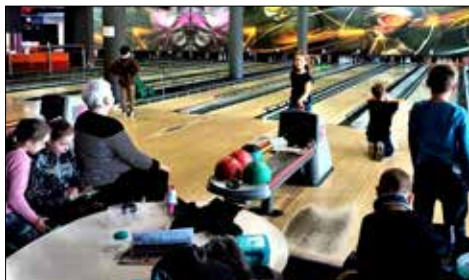
Trzynastkowicze w Gravitacji