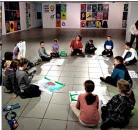
Odwiedziny Trzynastkowiczów w Biurze Wystaw Artystycznych