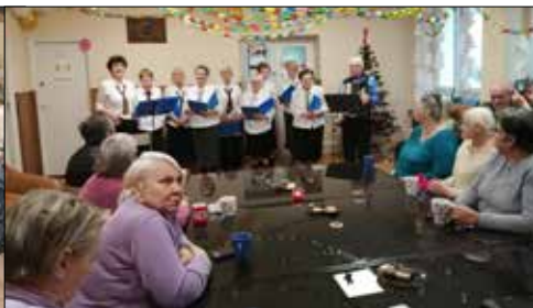
Gościnny występ zespołu „Alle Babki” w DPS „Opoka”