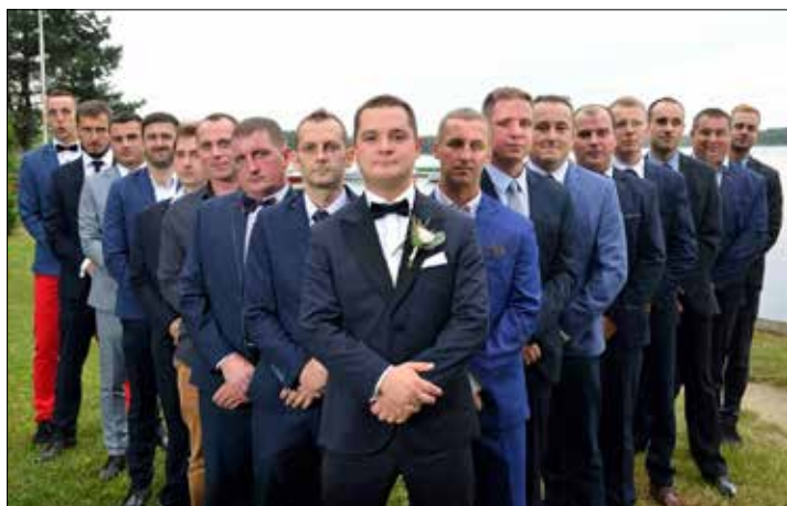
Wszyscy są kolegami z Górnśląskiego Klubu Sportowego „Murcki”

obecnej kadencji – do 1 kwietnia trzeba poczekać – okaże się co udało nam się załatwić. Jestem jednak optymistą i ufam, że „cuda” się zdarzają!