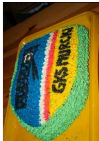
Tort urodzinowy GKS Murcki

W tak małym osiedlu wszyscy dobrze się znają i wiele o swoich bliźnich wiedzą, a to ma swoje plusy i minusy. Wymienię tylko te dobre strony: wszyscy czują się tutaj, jak w jednej wielkiej rodzinie. To jest szczególnie widoczne na piknikach, festynach czy na słynnym już Festiwalu Muszlownik, na który obecnie przyjeżdżają artyści z całej Polski. Właśnie, muszę tu dodać, że artyści