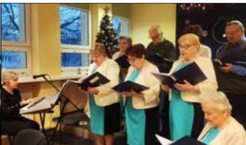
„Józefinki” kołedowały w Giszowieckim Centrum Kultury