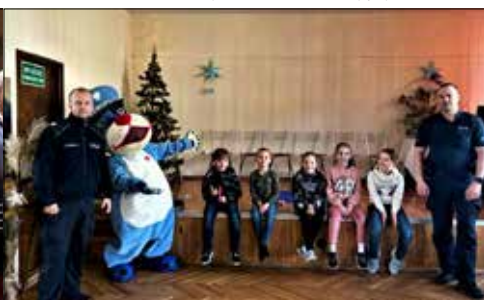
Spotkanie z policjantami w „Trzynastce”

sobotnie popołudnie wybrała się do Teatru Rozrywki w Chorzowie na „Sylwester na bis.” W tym roku Sylwester odbywał się pod hasłem „Rozrywka łączy pokolenia” i klubowicze z „Juwenii” przekonali się, że złote przeboje zawsze będą w modzie, a nowsze również kryją w sobie cenne wartości i rytm, który nie pozwala stać w miejscu. – Usłyszeliśmy niezwykle cove-ry znanych utworów, ale i klasyczne aranżacje, które przeniosły nas w inny wymiar