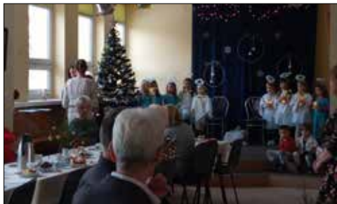
Noworoczno-karnawałowa impreza dla samotnych mieszkańców Osiedla Giszowiec