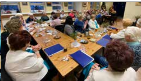
W kręgu spółdzielczych przyjaciół – klubowicze z „Józefinki” w GCK