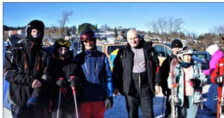
Grono uczestników zakopiańskiej eskapady

na nas w nadchodzącym czasie. Towarzyszą mu od ostatnich styczniowych dni zimowe ferie szkolne. Dział Społeczno-Kulturalny i nasze kluby były w styczniu tygłem tych wszystkich klimatów, ku zadowoleniu mieszkańców odwiedzających placówkę Katowickiej Spółdzielni Mieszkaniowej.