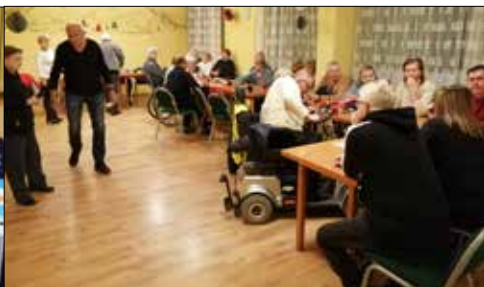
Noworoczne spotkanie osób niepełnosprawnych w klubie „Centrum”