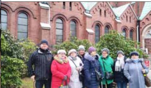
Klubowicze z „Józefinki” przed bazyliką w Panewnikach