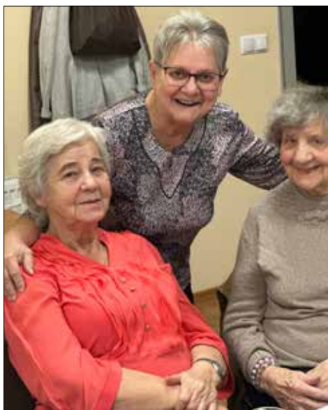
Na spotkaniu seniorów w „Juwenii”