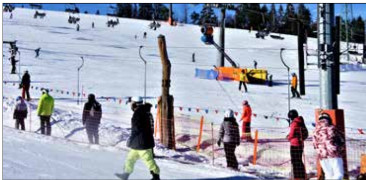
Na stoku w Białce

Za nami pierwszy miesiąc nowo rozpoczętego roku. Zima gościła w nim na dobre, więc rozmarzyła nas wizją śnieżnych uciech. A tu jeszcze ciągle w uszach brzmiały piękne koledy, jeszcze ciągle urok Świąt Bożego Narodzenia snuje nam się w pamięci. W ten nastrój wcina się inna zgoła nuta karnawału, a z nim zastrzyk energii, tak potrzebnej do realizacji zadań czekających