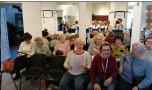
Do Ministerstwa ds. Samotności przybyły „Alle Babki”

Klub „Pod Gwiazdami” także zatopił się w nastroju świąt, dodatkowo upajając się urokami zimy. – Zima to najpiękniejsza