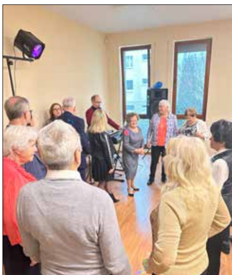
Zabawa w „Juwonii”

Święta Bożego Narodzenia wraz z Sylwestrem i Nowym Rokiem to w naszej świadomości jeden, spojony ze sobą, ciąg