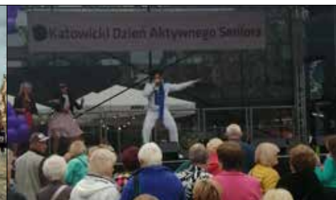
Klubowiczki z „Centrum” były na Rynku podczas Katowickiego Dnia Aktywnego Seniora

W akacje niewątpliwie głównie należały do dzieci. Większość organizowanych wówczas wydarzeń i atrakcji adresowana była właśnie do najmłodszych. Jesień, szczególnie ta złota jaką mamy, to czas seniorów. Tak dzieje się dlatego, że pasuje do ich życiowej złotej jesieni, ale też po letniej dominacji najmłodszego pokolenia, po prostu im się słusznie należy. We wrześniu więc sporo działo się w klubach z myślą o seniorach, choć oczywiście o dzieciakach nie zapomina się tu nigdy!