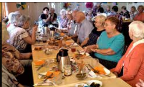
W „Trzynastce” - podwieczoraek przy kawie i ...