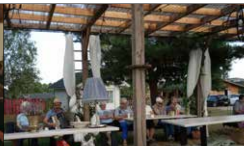
Wspólne muzykowanie giszowian w czasie wycieczki do Sokolego Rancza w Biskupicach