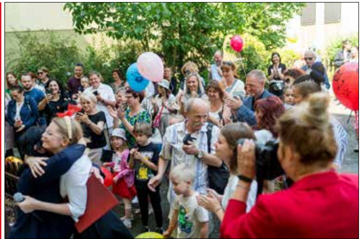
Radosne odsłonięcie Beboka zgrupowało wielu okolicznych mieszkańców

Hasła – pionowo: krewetka, zgrzebło, postrach, kreatura, Fasola, smutki, ajlant, zawada, bramkarz, naleśnik, statysta, Kociniak, Seneka, Medyka, chałat, Wesele – poziomo: skrzypek, Rafał Majka, represje, autostrada, meteor, urbanistka, samochwała, maestia, nadgarstek, amnestia, koktajbar, zakładka.