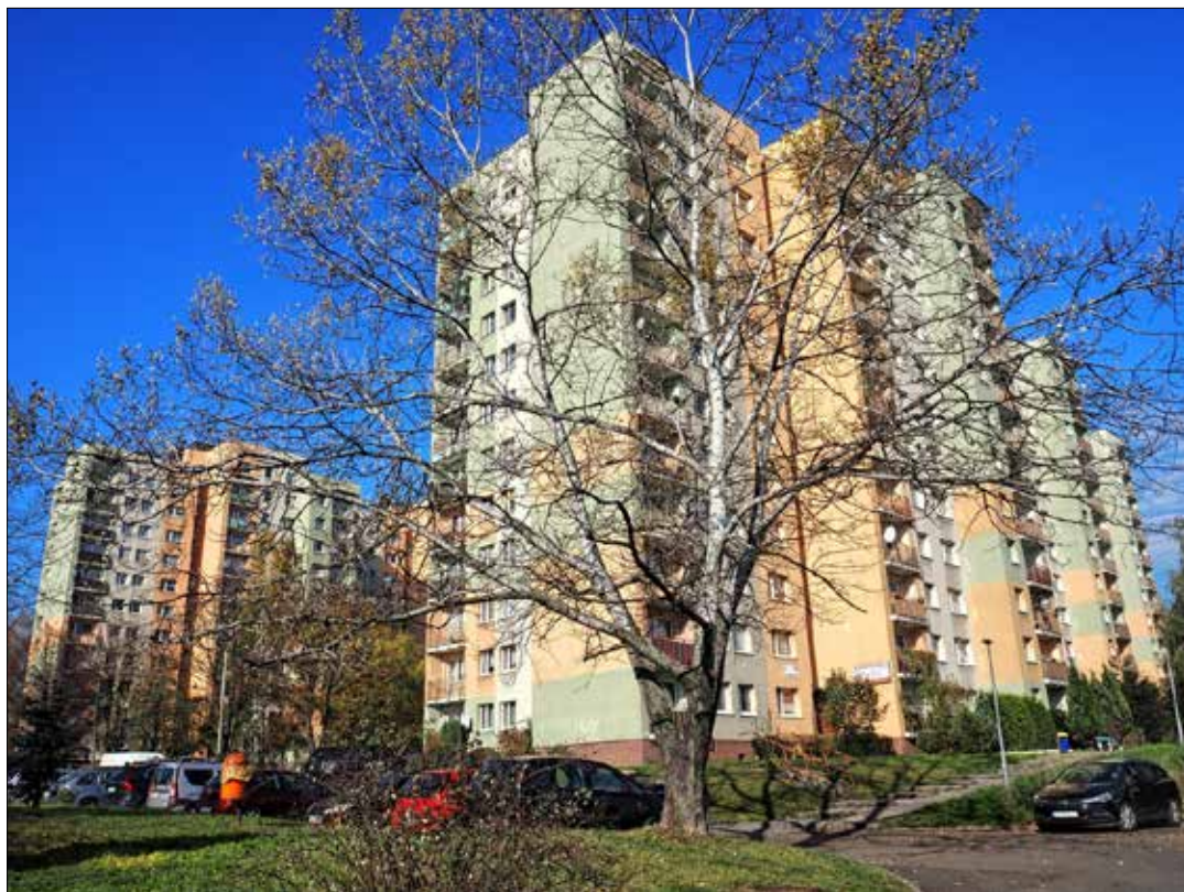
Budynki Katowickiej Spółdzielni Mieszkaniowej przy ul. Józefowskiej. Dobry przykład budownictwa wielkopłytowego

W trwającej długo (nieoficjalnej i oficjalnej) kampanii przedwyborczej do Sejmu i Senatu rywalizujące partie prześcigały się w coraz to innych propozycjach rozwiązania nękającego nasz kraj niedostatku mieszkań. Wcześniejsze, propagandowo hucznie ogłaszane, programy wspierania budownictwa mieszkaniowego kończyły się kląpą. „Mieszkanie dla młodych”, „Mieszkanie plus” a nawet niektóre TBS-y, okazały się fiaskiem i ich rządowi lanserzy musieli się przyznać do nierealności zapowiedzi i rozdętych obietnic. Z punktu widzenia spółdzielczości mieszkaniowej pomijanie jej w oficjal-