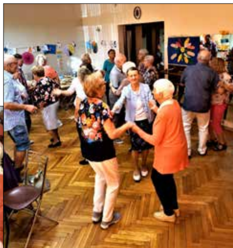
... dobrej zabawie