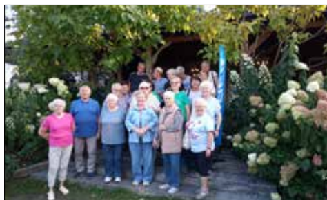
Seniorzy z Giszowieckiego CK na wycieczce w Biskupicach