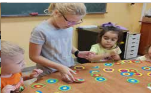
Dzień kropki w „Józefince”