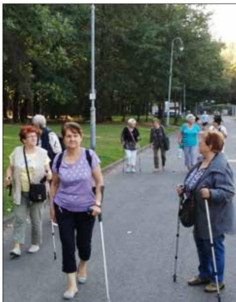
Z Koszutki na Zadole - czyli Poznaj i wypoczywaj

W „Trzynastce” zagościła wysoka kultura jeszcze w innej postaci. Otóż od czerwca odbywają się tu próby Inicjatywy Lokalnej „Młodzieżowa Orkiestra Rozrywkowa”, którą nasz klub wspiera użyczając na