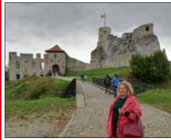
Ten zamek był celem wyprawy na piknik rodzinny

Również 7 października, ale na tyłko jednodniową eskapadę wybrali się mieszkańcy Osiedla Szopienice. Pojechali na „Piknik rodzinny” do Rabsztyna, na Jurze Krakowsko-Częstochowskiej, przygotowany staniem Rady i Administracji Osiedla. Grupa ponad 40 uczestników gościła w zajeździe Podzamcze. Jak na piknik przystało – były na świeżym powietrzu kiełbaski z grilla, biesiadowanie i radosna zabawa. W drodze na piknik uczestnicy zwiedzili Pustynię Błędownską - największy w Polsce śródlądowy obszar lotnych piasków i wydym.