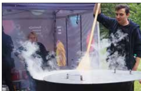
W takim kotle warzył się poczęstunek dla uczestników pikniku