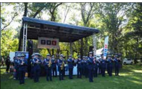
Dla Seniorów wystąpiła Reprezentacyjna Orkiestra Dęta Komendy Wojewódzkiej Policji