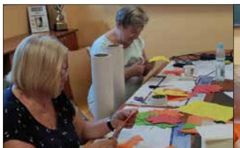
Artystyczne rękodzieło - tworzenie dekoracji w klubie „Józefinka”