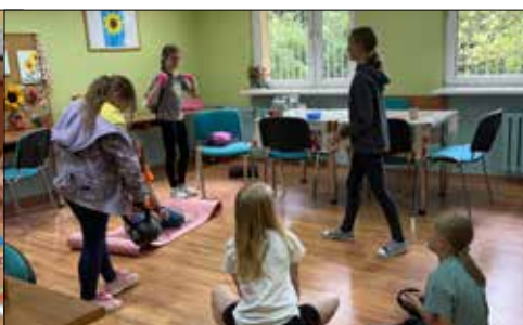
Klubowe zajęcia młodych w „Juwenii”

czas rękodzielniczych warsztatów oraz zwiedzili pobliskie lasy podróżując wozem konnym.