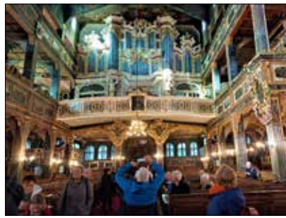
Zachwycające wnętrze Kościoła Pokoju w Świdnicy

W drugim dniu wycieczki jej uczestnicy odwiedzili hutę szkła „Julia” w Piechowicach, gdzie mieli wyjątkową okazję zobaczyć na własne oczy, jak współcześnie wygląda proces dmuchania szkła, formowania gorącej masy,