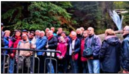
Mieszkańcy KSM przy Wodospadzie Szklarki

Wielu doznań dostarczyła mieszkańcom Katowickiej Spółdzielni Mieszkaniowej jesienna, 3-dniowa wycieczka po Dolnym Śląsku zorganizowana przez Dział Społeczno-Kulturalny w dniach 7-9. października br.