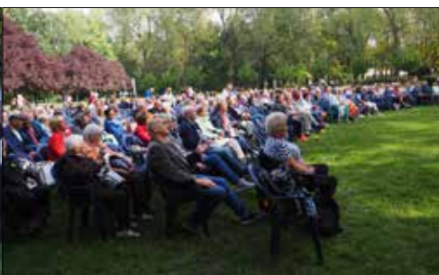
Rzesza uczestników pikniku w Parku Kościuszki