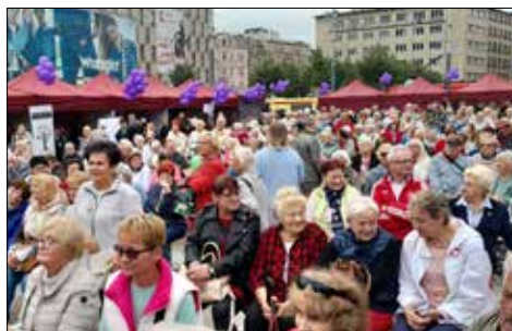
Tłum aktywnych Seniorów na Rynku