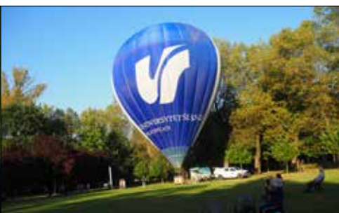
Na zakończenie pikniku ze Skweru Seniorów odleciał balon Uniwersytetu Śląskiego

Pośród niemal trzystu tysięcy mieszkańców Katowic seniorzy tworzą niemal 80-tysięczną część. Nic zatem dziwnego, że tak wielkiej części mieszkańców poświęcana jest znacząca uwaga władz miasta, różnych instytucji, organizacji i stowarzyszeń, pośród których istotną rolę odgrywają także działania Katowickiej Spółdzielni Mieszkaniowej, zwłaszcza poprzez Fundację Da Moc oraz spółdzielcze kluby. O nich piszemy na innych stronach „Wspólnych Spraw”. Tutaj wspominamy imprezy ogólnomiejskie, jakie w Katowicach odbywały się pod koniec września br. Pośród organizatorów i uczestników tych zdarzeń było również wielu członków KSM.