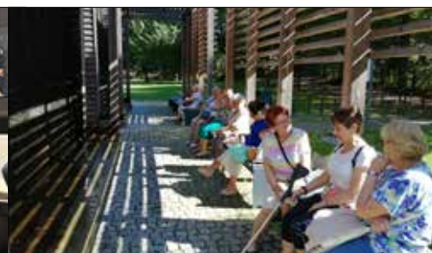
Wyprawa z „Centrum” do mikołowskiej tężni