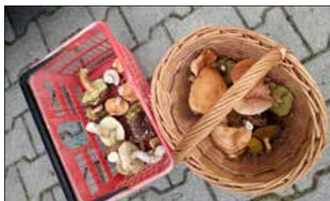
Plon grzybobrania giszowian w lublinieckich lasach był niestety mierny

Wrzesień to miesiąc, w którym bardzo często planowane są wycieczki. Aura wów-