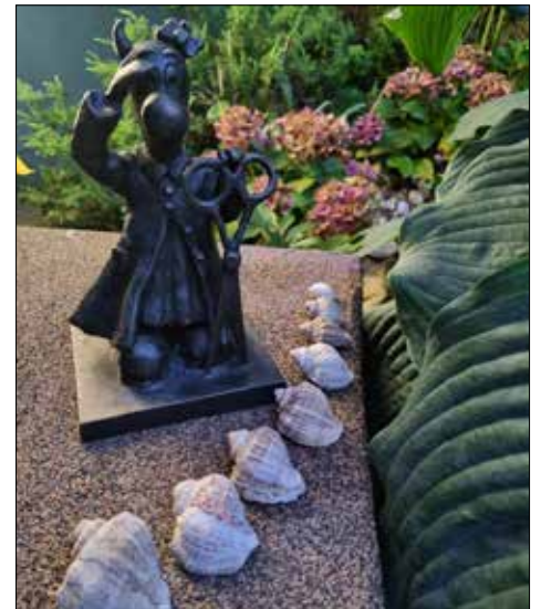
Bebok w całej okazałości

Miałam bardzo dobre oceny i oczywiście chciałam kontynuować naukę w szkole uczącej fryzjerstwa. Ale niestety zabroniono mi tego. Dlaczego? Otóż nasza wspaniała nauczycielka fizyki