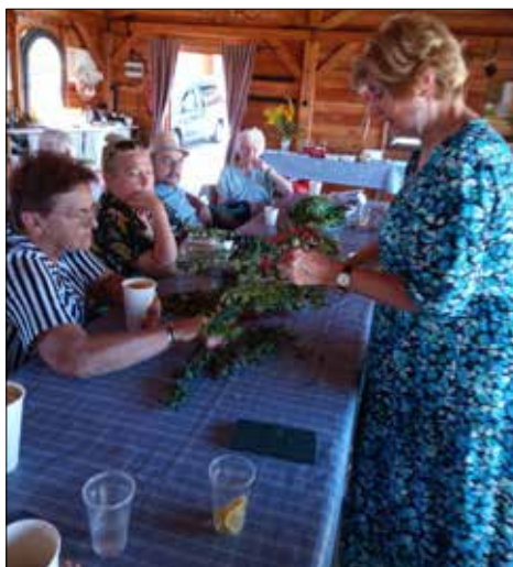
Giszowiccy seniorzy w Sokolim Ranczo w Biskupicach - poznali jak wykorzystywać jesiennie rośliny

Jak zauważyłam na początku, wrzesień należał w naszych klubach do seniorów,