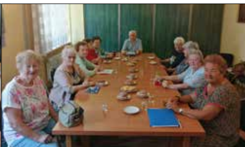
Spotkanie inauguracyjne powakacyjną działalność zespołu „Alle Babki”