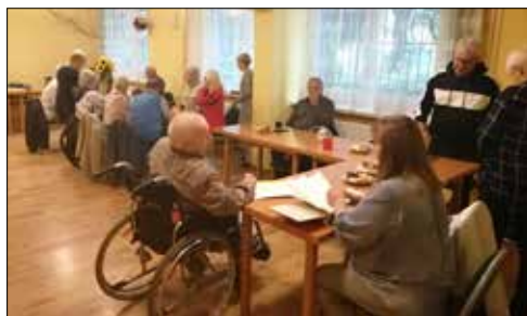
Powakacyjne spotkanie w klubie „Centrum” osób niepełnosprawnych - Tacy Sami

Także klub „Józefinka” przywitał jesień spacerem po parku. Kasztany, żołądździe kolorowe liście, kwiaty dzikiej róży, suche kwiaty, przyniesione z takiej przechadzki oraz ze spaceru po ogrodach, będą ozdobą „Józefinki” w najbliższych dniach.