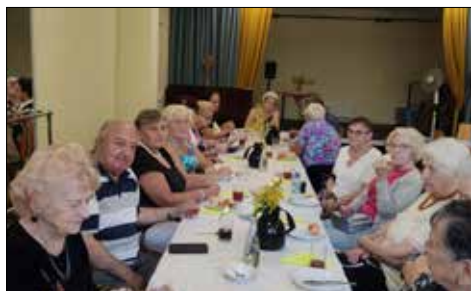
Pierwsze jesienne spotkanie w Klubie Seniora w „Józefince”