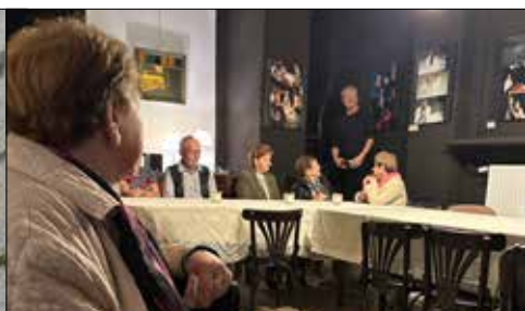
„Juwenia” na spektaklu w Teatrze Bez Sceny