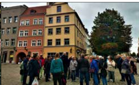
KSM-owscy wycieczkowicze na świdnickiej starówce