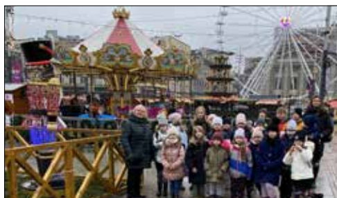
Giszowieckie dzieci trafiły na jarmark na katowickim rynku

Styczeń, to miesiąc, w którym świętujemy Dzień Babci i Dzień Dziadka. Wiadomo, jak ważne są to osoby w życiu każdej rodziny. Są tymi, którzy przekazują tradycje, a tym samym stoją na straży naszej tożsamości, stanowią ważne wsparcie dla funkcjonowania młodszej generacji, są emitorem rodzinnego ciepła.