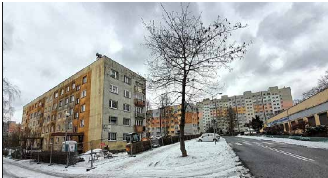
Osiedle Giszowiec – rektyfikowany obecnie budynek przy ul. Wojciecha 35 - 35b na fotografii po lewej stronie