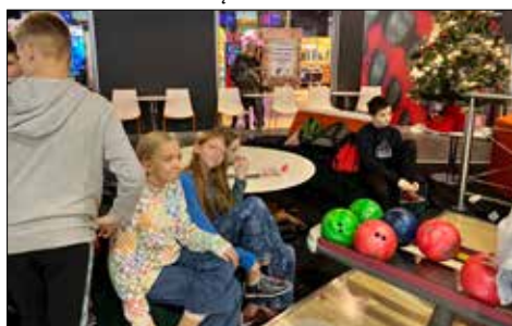
W kręgle chętnie grają dzieci ze wszystkich klubów