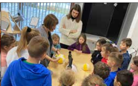
Z Giszowieckiego CK wybrano się na Warsztaty w GeoSferze w Jaworznie