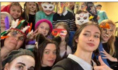
... przy udziale rówieśników z pozostałych spółdzielczych klubów