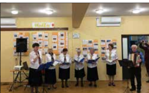
„Alle Babki” wystąpiły gościnnie w Klubie Seniora Spółdzielni Mieszkaniowej Załęska Hałda

zespołu „Alle Babki” w Spółdzielni Mieszkaniowej „Załęska Hałda”. Po pierwszej części występu – kolędowej – muzycznym kwiatkiem dla babć i dziadków były piosenki specjalnie im dedykowane. Na zakończenie spotkania nasz zespół uczestniczył w prezentacji filmowej utworów wykonanych przez dzieci dla babci i dziadka z okazji ich święta.