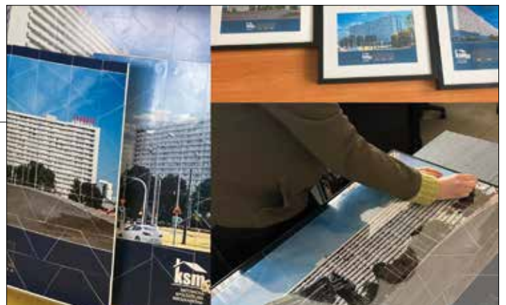
Końcówka układania superjednostkowych puzzli