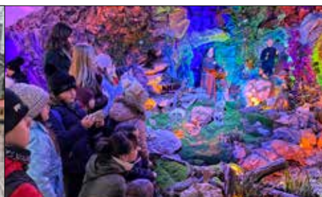
Panewnicka szopka fascynowała młodych giszowian