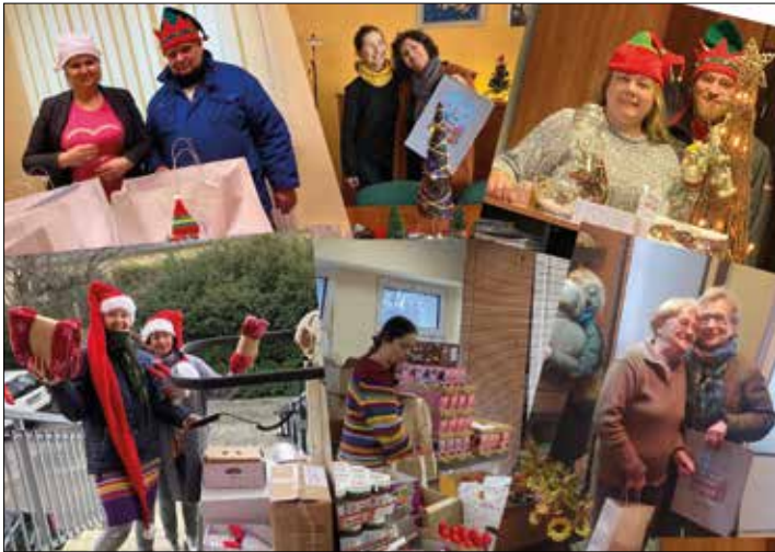
Świąteczne niezbędni ufundowane z 1% odpisów podatkowych trafiły do osób potrzebujących pomocy

cowego spotkania integracyjnego w plenerze pn. „Super Piknik-65” z okazji jubileuszu 65-lecia Katowickiej Spółdzielni Mieszkaniowej w Osiedlu Superjednostka uniemożliwiły złożenie z foto-puzzli obrazów z wizerunkiem naszego „super budynku”. Niezłożone elementy zostały wszakże ochronione. Mimo upływu czasu mieszkańcy osiedla zaangażowali się i poświęcili swój czas na dokończenie układania puzzlowych fotografii, które zostaną w przyszłości powieszone w holach wejściowych w każdej z trzech klatek „Superjednostki”.