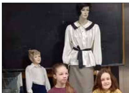
Jak to ongiś w szkole bywało dowiedziały się dzieci z „Juwenii” i „Klubu pod Gwiazdami”