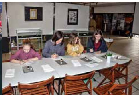
Pisania stalówką i kaligrafii uczyli się klubowicze z „Juwenii” i „Gwiazd”

Po zajęciach w murach klubu, szybko ponownie opuszczono przytulną siedzibę, by poszukać