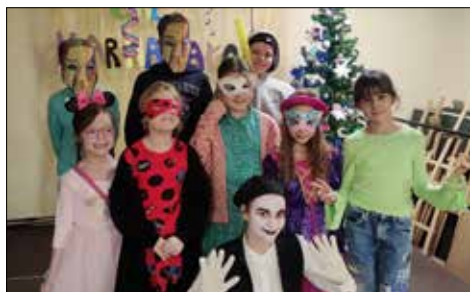
W „Józefince” młodzież bawiła się na balu karnawałowym kończącym zimowe ferie...

W Bibliotece Śląskiej zajrzeli do prawie wszystkich jej zakamarków. Dzieci zobaczyły tam najstarsze zbiory biblioteczne, odwiedziły pracownię intrologatorską oraz pracownię mikrobiologiczną. Dzieci, jak to dzieci doznają olśnienia w momentach, które dorosłym nie muszą wydawać się aż tak atrakcyjne i oto dla milusińskich z GCK najciekawszym punktem zwiedzania była obserwacja ...wagoników, które przywożą i odwożą biblioteczne zbiory. Wśród licznych aktywności giszowianie znaleźli też czas na zabawę i naukę zasad rywalizacji, a to w czasie wyjścia na kręgle. Zgodnie z założeniem różnorodności zajęć, jednego dnia zawitali na warsztaty muzyczne, innego – zmierzili się z doświadczeniami i różnymi nauko-