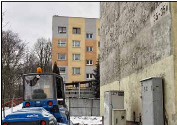
Prace rektyfikacyjne przy budynku u. Wojciecha 35 - 35b