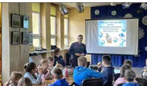
Spotkanie z policjantem w GCK