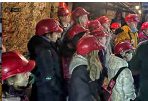
Giszowianie na wyprawie do zabrzańskiej sztolni „Królowa Luiza”

Udana okazała się także wyprawa do Kręgielni Grawitacja. Liczna grupa dzielnie stanęła do rywalizacji. Pomimo, że kule są ciężkie, małym, ale wielkim duchem graczom udało się zdobyć dużą ilość punktów. Gra była bardzo wyrównana,