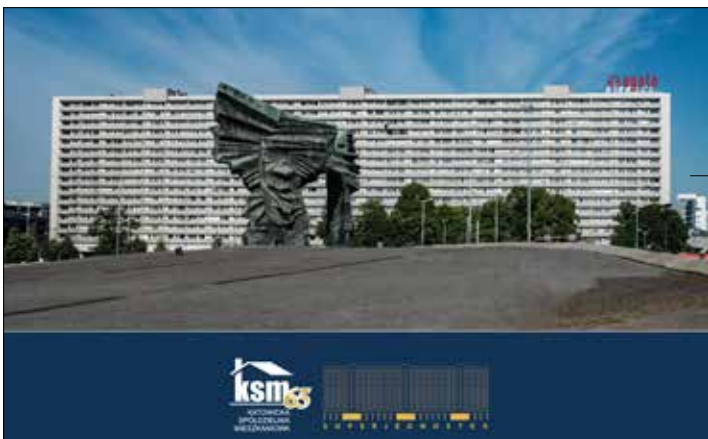
Jeden z puzzli Superjednostki

Pisaliśmy o tym we „Wspólnych Sprawach” – przypomniecie sobie Drodzy Czytelnicy, że nagle załamanie się pogody i ulewny deszcz podczas czerw-