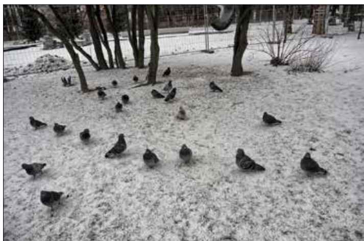
Te gołębie są w tym miejscu nie bez powodu. Wiedzą, że ktoś z mieszkańców budynku za drzewkami na pewno rzuci im na ośnieżony trawnik coś do jedzenia

No i oczywiście ptasie karmniki trzeba co pewien czas czyścić. Dla prawdziwych ptasich przyjaciół nie powinno to być trudnością.