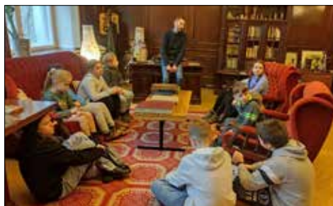
W Domu Oświatowym BŚL. dzieci z „Trzynastki” i „Józefinki” poznawały pamiątki po A. Szklarskim - autorze serii książek o Tomku Wilmowskim

Giszowieckie CK też nie zapomniało w styczniu o głodnych kultury, dojrzałych bywalcach klubu. Melomani mogli wysłuchać wspaniałych taktów muzyki filmowej na koncercie w Filharmonii Śląskiej. Dla tych, którzy wolą utwory dramatyczne przygotowano wyjście do teatru w ramach XVI