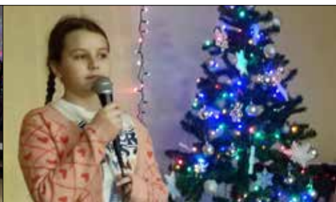
„Józefinka”: zorganizowano konkurs MAM TALENT