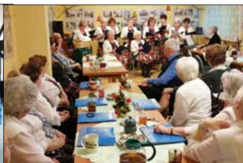
W klubie „Centrum” wspólnie kolędowały „Józefinki” i „Alle Babki”

N owy, kolejny rok jak zawsze powitali nasi klubowicze uroczystymi spotkaniami. Myślimy, jaki też będzie czekający nas czas i choć te rozmyślenia nie wolne są od obaw, to przecież wolimy mieć nadzieję, że przyniesie zmiany na lepsze. A skoro tak, to podczas owych spotkań dominuje uśmiech, radość, to i jego uczestnicy ruszają w tany. Tegoroczny styczeń był także miesiącem ferii zimowych (niestety bezśnieżnych) dla katowickich dzieci i młodzieży – i to była kolejna okoliczność określająca program działalności klubowej w pierwszym miesiącu roku. Oczywiście nie zabrakło naszym klubom energii i pomysłów również dla tych, których już ferie nie dotyczą.