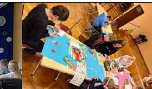
Trzynastkowicze tworzą mapę marzeń