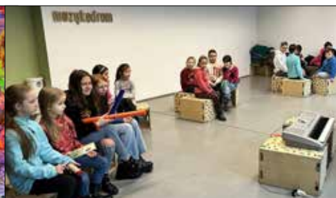
Dzieci z „Trzynastki” na zajęciach w Muzykodromie w Kstowicach Mieście Ogrodów