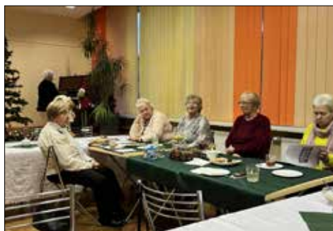
Kolędowanie seniorów w klubie „Trzynastka”