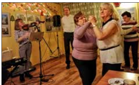
Taneczne rytmy nie ominęły klubu „Centrum”

„Juwenia” wspólnie z klubem „Pod Gwiazdami” zorganizowały swoim dzieciom rozrywkę podczas ferii. Chętnie korzystały z wielu bezpłatnych warsztatów i atrakcji w ramach Zimy w Mieście Katowice, aby zapłacić czas milusińskim