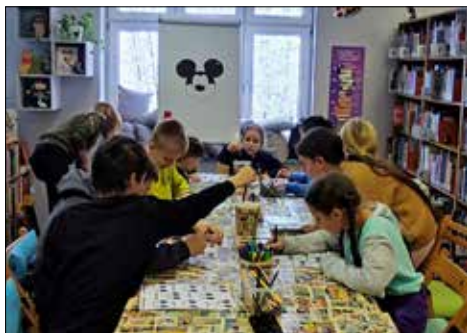
Dzieci z os. Ściegiennego na warsztatach KOMIKS I JA Miejskiej Biblioteki Publicznej