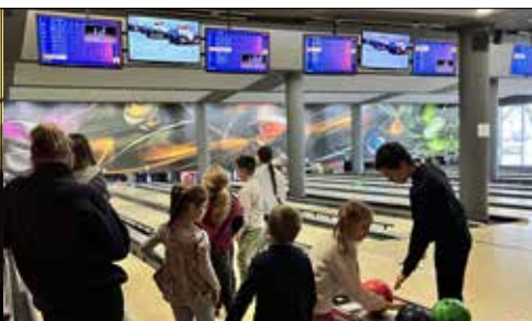
Aktracje kręglejmi „Grawitacja”