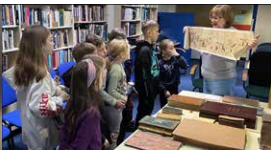
Tajemnice starych ksiąg i innych zbiorów poznali giszowianie w Bibliotece Śląskiej