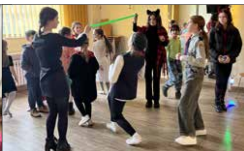
Wesoła zabawa karnawałowa

Zainteresowanie wzbudziły także warsztaty w Bibliotece Śląskiej, gdzie dzieci zobaczyły największą i najmniejszą książkę w zbiorach tej księżnicy oraz uczestniczyły w warsztatach muzycznych w Instytucji Katowice Miasto Ogrodów.