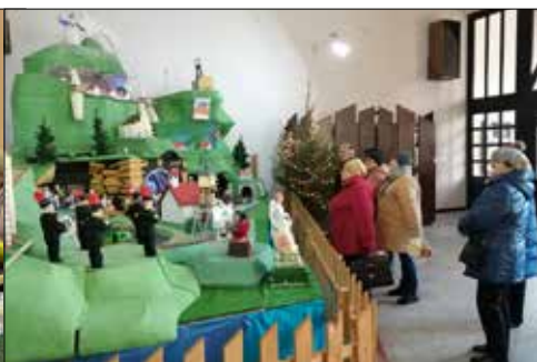
Seniorki z „Centrum” oglądały ruchomą szopkę na Giszowcu