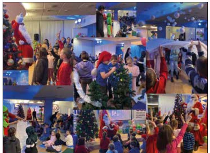
Impreza mikołajkowa współorganizowana przez Fundację Da Moc

Przypominamy także, że Fundacja Da Moc posiada także swoje konto 98 1090 2008 0000 0001 4784 6506 , na które zawsze można wpłacać darowizny.