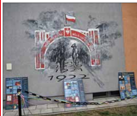
Mural „Śląska Brama do Polski”