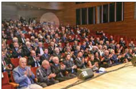
Gorącymi oklaskami nagradzano osoby uhonorowane odznaczeniami