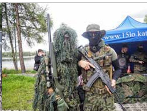
Żołnierska prezentacja uczniów z XV. LO

Katowic, a potem dalszych miast. Na moście szopienickim żołnierzy witali przedstawiciele śląskiego życia politycznego, społecznego i kulturalnego z Wojciechem Korfantym na czele.