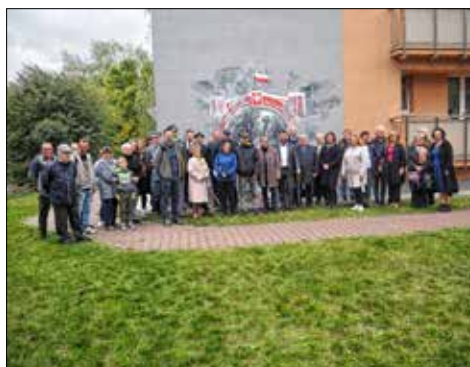
Grono osób odsłaniających mural

Oprawę muzyczno - wokalną stanowił występ zespołu Chwila Nieuwagi . Swoje