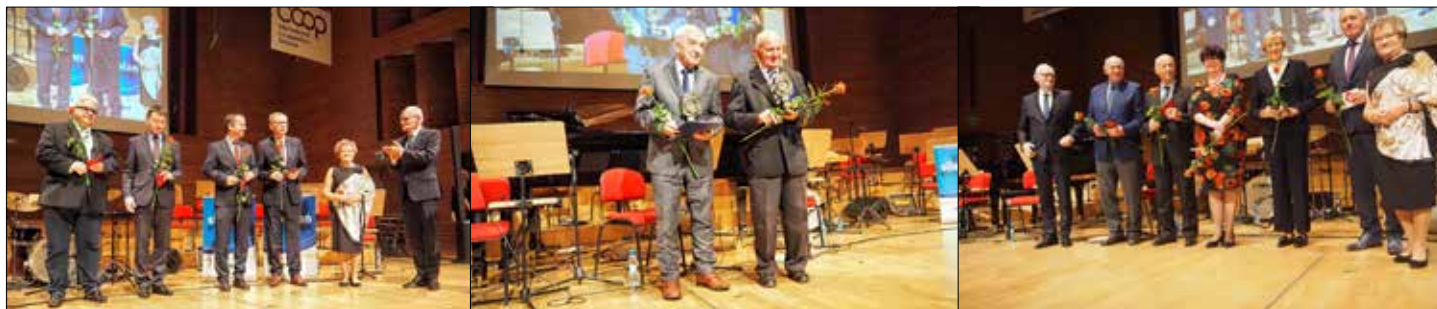
Wyróżnieni Złotymi Odznakami Zasluzony dla Budownictwa