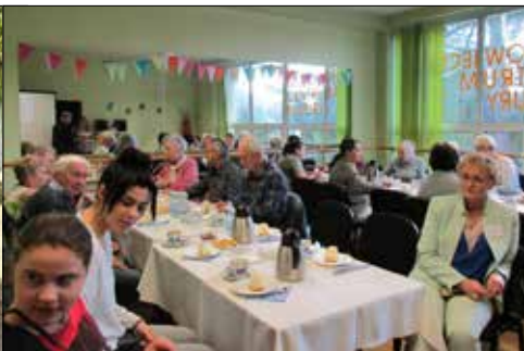
Podczas prelekcji w GCK o pamięci i jej zaburzeniach

Wrzesień w klubie „Centrum” przynosił uczestnikom zajęć bardzo różne doznania. O ich skali przekonują choćby informacje, o których poniżej. Oto na przykład klubowicze wysłuchali minirecitalu organowego, by innym razem pobawić się