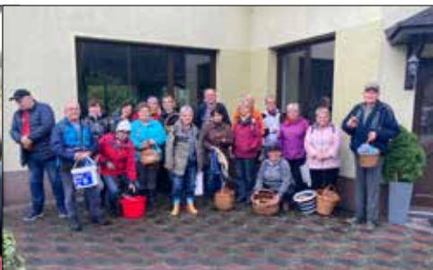
Klubowicze z „Juwenii” też byli na grzybobranii