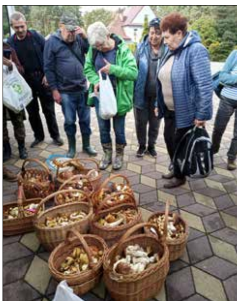
Plon grzybobrania prezentują giszowianie

Wakacje były jak zawsze czasem podróży, wycieczek, wyjazdów. Ale takie peregrynacje nigdy się nie znużą, bo przecież dostarczają wielu nowych wrażeń. Klub „Centrum” mimo, że ledwo co skończyła się kanikuła, nie ustawał w organizowaniu wypadów poza Katowice. I wędrowcy z Koszutki odwiedzili jedno z najstarszych miast na Śląsku – Czeladź, a na jej terenie park Grabek. – Park, jeszcze w barwach babiego lata, zachwycał swoim starodrzewiem. Spacerowaliśmy wzdłuż zalewu po drewnianym pomoście, dotarliśmy do zabytkowego Ogrodu Morwowego. Podczas spaceru alejkami podziwialiśmy meandry wijącego się na całym obszarze parku strumyczku z liczny-