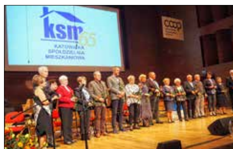
Uchonorowani Odznaką za Zasługi dla KSM