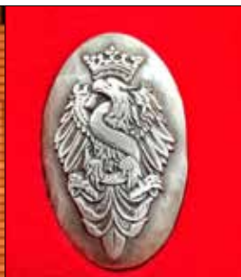
Medal Senatu RP