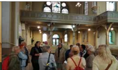
Koncert organowy i zwiedzanie katowickiego Kościoła Ewangelickiego to plon wyprawy z Klubu „Centrum”