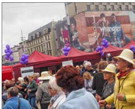
Seniorzy opanowali rynek

W mieście działa bowiem m.in. Katowickie Centrum Seniora przy ul. Słowackiego 27. Jest to miejsce przyjazne seniorom, którzy mogą tam spędzać swój wolny czas na różnego rodzaju warsztatach np. rękodzieła, kulinarnych oraz szkoleniach, dowiedzieć się wielu ciekawych informacji. Centrum prowadzi Fundacja Rozwoju Ekonomii Społecznej. (pas)