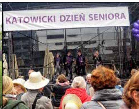
Przeboje ABBY śpiewali seniorom artyści z Agencji theART