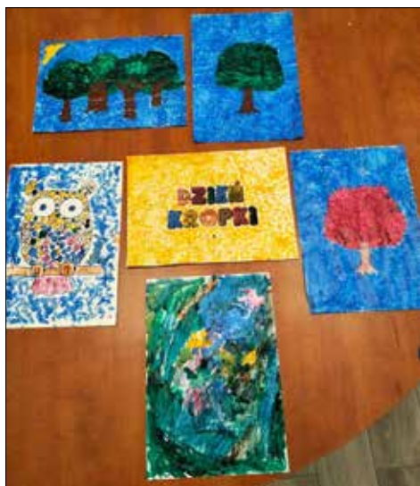
Artystyczny plon Dnia Kropki w „Józefince”