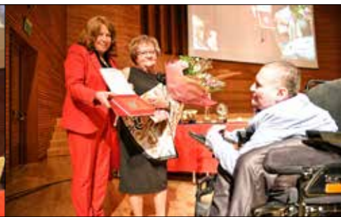
Senatorowie RP Marek Plura i Joanna Sekuła podczas przekazywania dla KSM medalu Senatowi RP