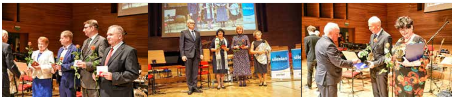
Wyróżnieni Srebrnymi Odznakami Zasluzony dla Gospodarki Komunalnej