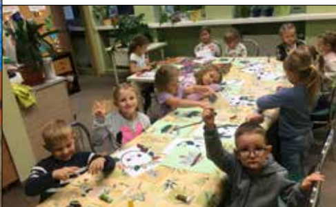
GCK: zajęcia plastyczne dla dzieci