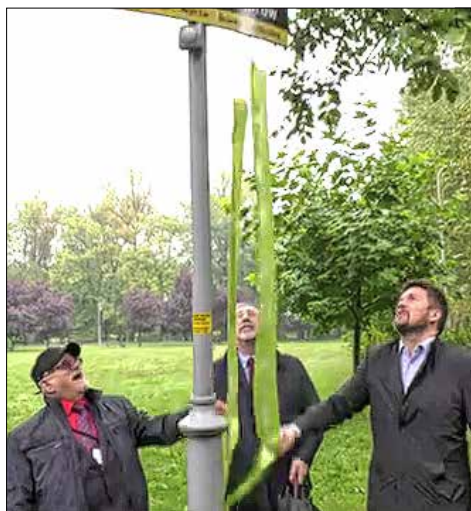
Moment odsłonięcia tabliczki z nazwą Skwer Katowickich Seniorów