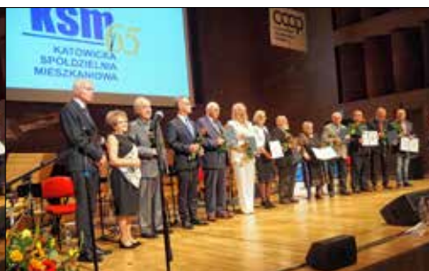
Uchonorowani wpisem do Księgi zasłużonych dla KSM