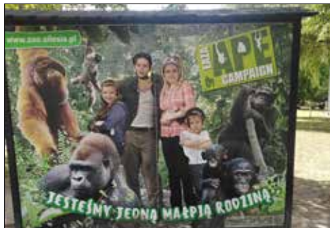
Trzynastkowice w Śląskim ZOO zrobili sobie fotografię z zabawną planszą

„A mnie jest szkoda lata” – to słowa popularnego niegdyś przeboju, który