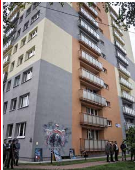
Budynek z murałem - ul. Morawy 119C

W Osiedlu Szopienice Katowickiej Spółdzielni Mieszkaniowej, na wieżowcu przy ul. Morawy 119c odsłonięty został 28 września mural: Śląskie Brama do Polski! To już trzeci mural jaki głównym staraniem spółdzielczej Fundacji Da Moc został wykonany na budynkach KSM. Przypomnijmy, że pierwszym był mural na domu przy ul. Łabędziej 21 z postacią Alfonsa Zgrzebnioka bohaterskiego dowódcy w powstaniach śląskich – patrona osiedla KSM. Drugim obrazem upamiętniają-