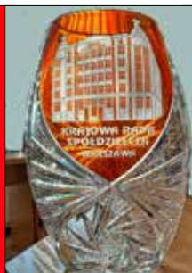
Puchar Krajowej Rady Spółdzielczej