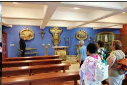
W Tychach wycieczkowiczki z klubu „Centrum” zwiedzały kościół pw. św. Karoliny

Wrzesień to czas powrotu aktywności działających w klubach sekcji zainteresowań. W Klubie „Centrum” wznowił spotkania zespół wokalny-muzyczny „Alle Babki”, odbyły się także spotkania inauguracyjne i towarzyskie dla se-