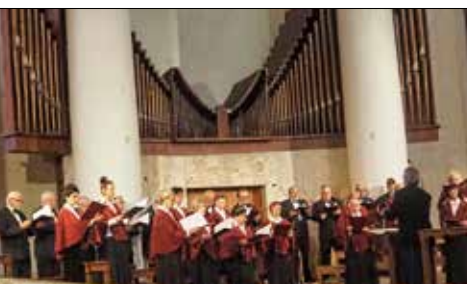
Śpiew chóru stanowił artystyczną oprawę liturgii