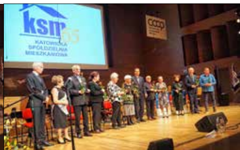
Uchonorowani Odznaką z Laurem za Zasługi dla KSM