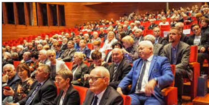
Uczestnicy jubileuszowej gali KSM

Spółdzielcy - członkowie i stworzona przez nich Katowicka Spółdzielnia Mieszkaniowa bilansują w roku 2022 swoje wspólne dokonania, poczynając od 7 lipca 1957 roku, kiedy to 19 pracowników katowickiego Biura Projektów Budownictwa Miejskiego „Miastoprojekt” startując od zera, od własnych chęci tylko, założyło spółdzielnię mieszkaniową. KSM współcześnie zajmuje ważne miejsce na mapie Katowic. Jest wiodącą w woje-