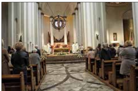
W trakcie mszy świętej odprawionej w Katedrze pw. Chrystusa Króla