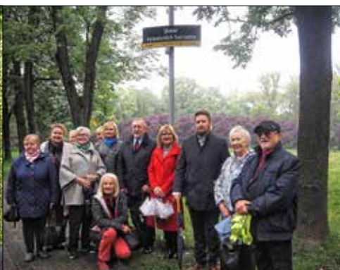
To tutaj jest to parkowe miejsce dla seniorów