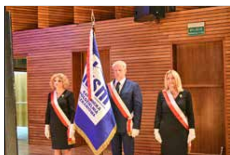
Poczet sztandarowy KSM

wództwie i w skali kraju. Tworzą ją ponad 19 tysięcy członków, a przez minione lata członków było znacznie więcej, bo aktualny, najnowszy numer członkowski to: 66.947. W swoich zasobach, w 17 osiedlach powstałych w różnych dzielnicach miasta, KSM posiada 345 budynków wielorodzinnych. Ma z czego być dumną.