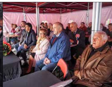
Na krótko, z powodu deszczu, trzeba było się schronić pod namiotem