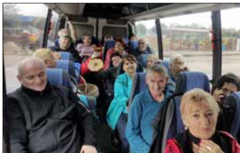
Józefinkowicze w autobusie jadą oczywiście na grzybobranie