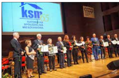
Uchonorowani wpisem do Księgi zasłużonych dla KSM