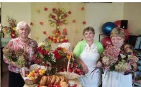
Prezentacja darów jesieni w „Józefince”