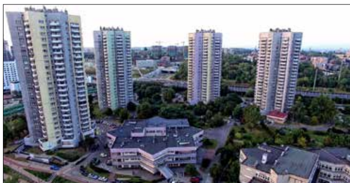
Osiedle Gwiazdy Katowickiej Spółdzielni Mieszkaniowej