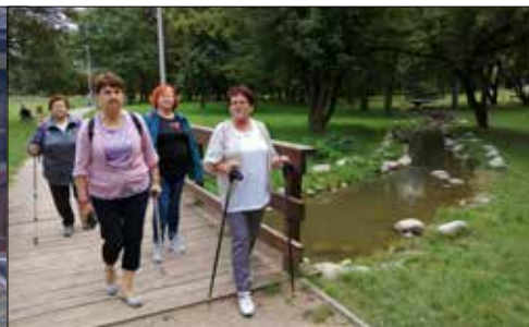
Panie z „Centrum” były w czeladzkim parku Grabek

W rzesień – to po wakacyjnych fajerwerkach – powrót do normalności. Ale do normalności nie znaczy ani do nudy, ani szarości. Wrzesień to przecież miesiąc niezwykle urokliwy. To piękny miks późnego lata z nieśmiało wkraczającą na scenę natury barwną jesienią. To czas, kiedy stęsknieni za sobą bywalcy klubowych zajęć i członkowie sekcji zainteresowań, spotykają się po długiej przerwie i już sam ten fakt jest dla nich ważnym i miłym przeżyciem. A przecież w klubach czekają też na nich nowe pomysły, nowe propozycje spędzenia wspólnie czasu.