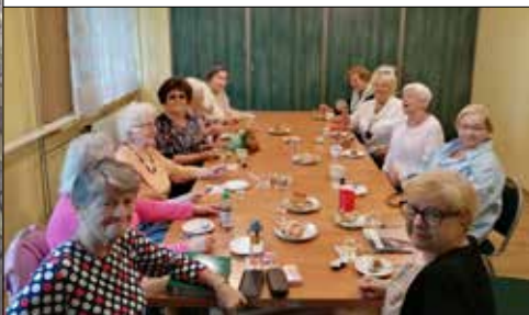
Inauguracja działalności Koła Emerytów w klubie „Centrum”