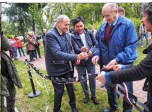
Przecinanie łańcucha i wstążek