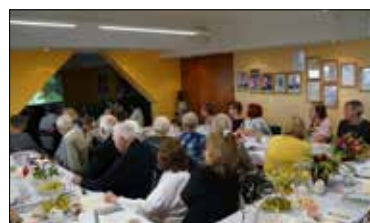
Wspomniowe spotkanie w Haperowcu

Potem zebrani uczestniczyli we wspólnym muzykowaniu (każdy otrzymał śpiewnik) z siemianowickimi artystami: Gerardem Szol-