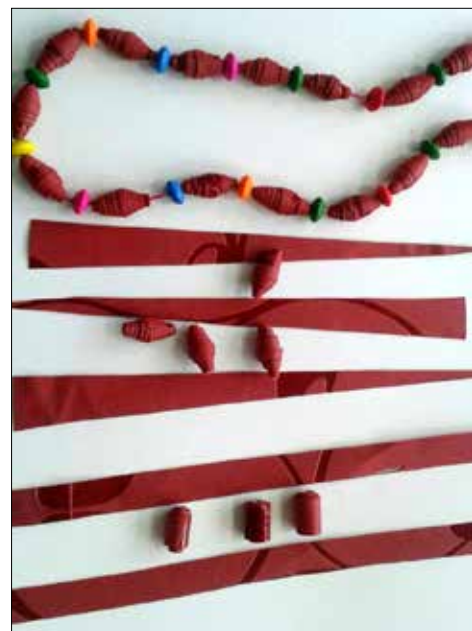
Taki finał naszych prac też być może

Porada: taką biżuterię można też wykonać z kolorowych czasopism (gratisowymi – reklamowymi zarzucając nas markety i sieci handlowe), ale koraliki wychodzą wtedy dużo delikatniejsze. Aby uzyskać inny kształt koralika wystarczy wyciąć kilka prostych pasków o szerokości 1,5 cm pasków i dalej postępować jak wyżej. Dla ciekawszego efektu, własnoręcznie wykonane koraliki można naprzemiennie nawlec z koralikami, które są