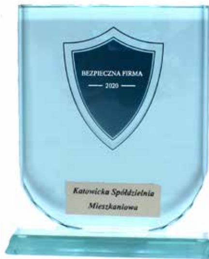
Certyfikat i statuetka przyznanej KSM, a omówionej na str. 4, nagrody „Bezpieczna firma”

F undamentem istnienia Spółdzielni jest oparcie jej działalności na zasadzie demokratycznej samorządności. Na istnieniu i wypełnianiu swych zadań przed organy Spółdzielni: Walne Zgromadzenie, Radę Nadzorczą, Zarząd, Zebrania Osiedlowe, Rady Osiedli. Sądzę, że wszyscy nasi członkowie mają jeszcze na świeżo w pamięci jak wielkim wysiłkiem logistycznym było zorganizowanie we wrześniu 2020 Walnego Zgromadzenia (czyli o kwartał później od pierwotnych zamierzeń – ale przecież mimo to szybciej niż przyzwolił prawodawca!). Obrady