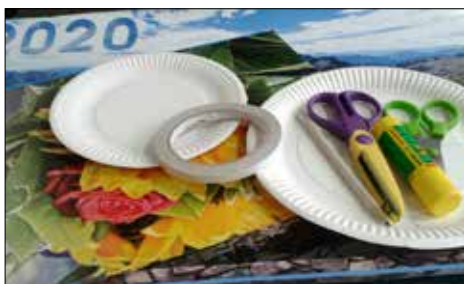
Chcąc zrobić karnawałowy kapelusz - przygotujmy sobie to, co widać na zdjęciu

W cyklu zajęć „Ferie na wesoło i kolorowo”, jaki zagościł na spółdzielczym Facebooku, proponujemy sposób na uprzyjemnienie sobie spędzanego w domowym zamknięciu czasu, a jednocześnie na pomysły recykling kalendarzy z poprzednich lat. Karnawał w pełni,