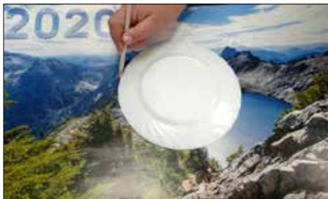
Tworzenie kapelusza - etap pierwszy