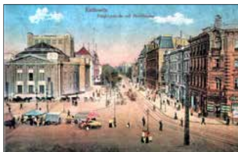
Katowice na starej widokówce. Skonfrontujcie - co pozostało, a co odeszło do historii