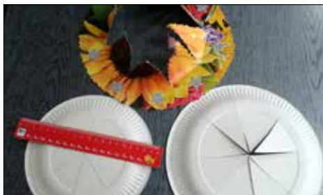
Tworzenie kapelusza - etap trzeci

więc może się przydać kolorowy kapelusz idealny na domową zabawę.