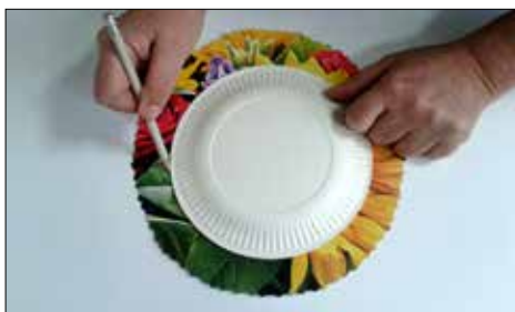
Tworzenie kapelusza - etap drugi