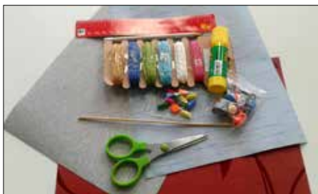
Tego potrzebujemy by zrobić koraliki

Potrzebne materiały: kawałki miękkiej taśmy lub kolorowe kartki z bloku technicznego (A4), ołówek, linijka, patyczek do szaszłyków,