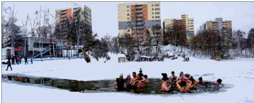
Osiedle Szopienice: morsy kąpiące się w Morawie