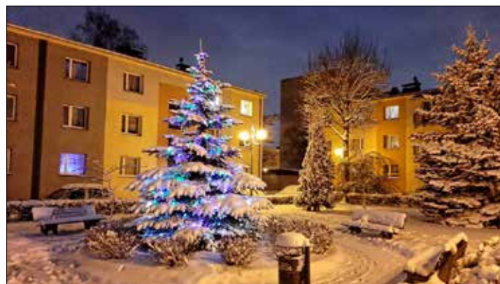
Zaśnieżone choinki na osiedlach KSM: Murcki - ul. Mruczka 5a (zdjęcie górne) i Mruczka 9 (zdjęcie dolne prawe) oraz im. ks. Fr. Ściżyły - ul. Nagórników 8 (zdjęcie dolne lewe)

Białe Katowice pięknie wyglądają. Dzieci zwolnione z wprowadzonego wcześniej przez władze państwowe „sanitarnego aresztu domowego” są śniegiem zachwycone. Wykorzystują najmniejsze nawet wzniesienia do saneczkarstwa. Niektóre wybierają się aż do Parku Kościuszki, by zmierzyć