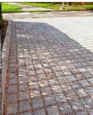
OSIEDLE IM. F. ŚCIGAŁY. Nowa nawierzchnia miejsc postojowych - ul. Wajdy 25