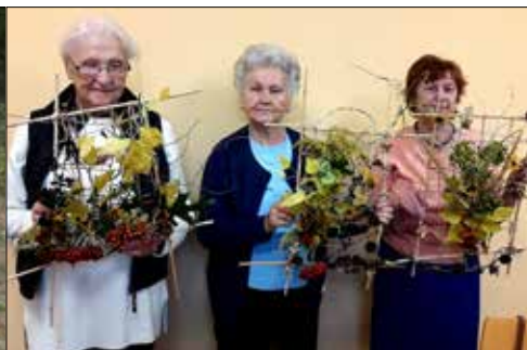
„Józefinka”: piękne stroiki i ich twórcynie

L edwo po wiosennej fali pandemii zdołaliśmy nieco odżyć, korzystając ze słonecznych dni, wyjeżdżając na wakacje, ledwo nasze kluby, podobnie jak i inne placówki kulturalne wznowiły działalność – znowu wirus przypuścił atak. Chociaż nie ludziliśmy się, że będzie inaczej, to przecież mieliśmy nadzieję, iż nie stanie się to aż tak szybko i z taką siłą. Cóż, ponownie więc trzeba było studzić nasze zapalały i hamować aktywność klubową. Ale co się udało jeszcze przeżyć, zrealizować, doświadczyć – to nasze! Wspomnienia o tych wydarzeniach niechaj będą słonecznym promykiem w zamglone, jesienne, kwarantannowe dni.