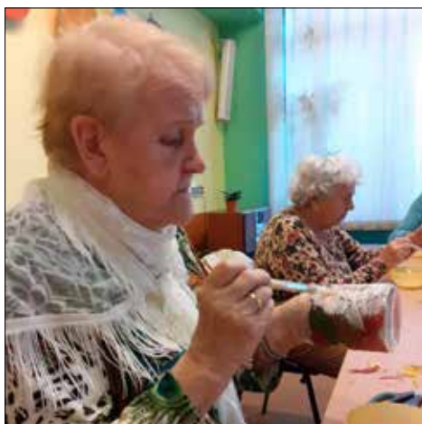
Klub Seniora w „Gwiazdach” – warsztaty „Barwy jesieni”