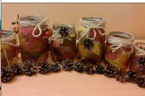
„Gwiazdy”: te lampiony wykonali seniorzy...