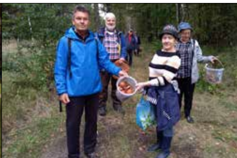
„Trzynastka” była na grzybobraniu