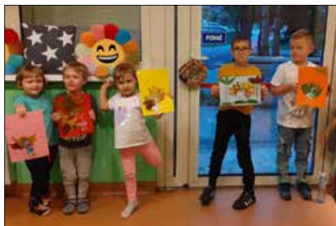
Najmłodszy klubowicze w „Gwiazdach” i ich prace plastyczne

W sztuce obok doskonałego opanowania warsztatu ważne są emocje, to co twórca pragnie przekazać innym – czy to będzie jakaś konkretna treść, czy tylko odczucia. To drugie najczęściej decyduje, że po pędzel sięgają osoby, które zajmując się zawodowo zupełnie czymś innym, mają potrzebę podzielenia się z innymi tym, „co im w duszy gra”. Często dzieje się tak w momencie, kiedy w ich życiu następuje jakiś przełom. Tak właśnie było w przypadku pań, których obrazy zawisły na wystawach w dwóch naszych klubach.