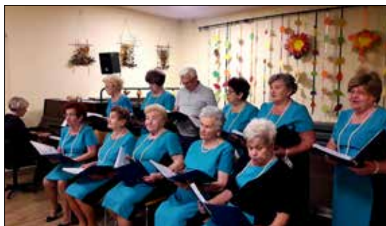
Pierwszy od marca występ „Józefinek” dla seniorów

W klubie „Juwenia”, podczas podobnych zajęć, seniorzy zdobili drewniane szkatułki. Upiękkszone własnoręcznie skrzyneczki zabrali do domu, by móc schować w nich swoje małe skarby. Innego dnia też było twórczo i ciekawie – seniorzy mogli bowiem poznać ciekawą technikę artystyczną, trenując przy tym precyzję oraz cierpliwość. Za pomocą rysika i specjalnie przygotowanej do tego zdra-