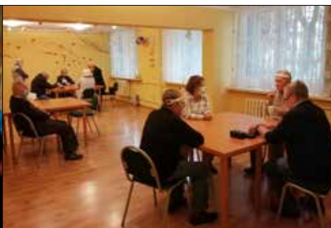
Rozgrywki brydżowe w klubie „Centrum”