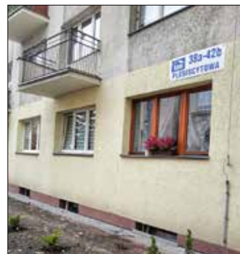
ŚRÓDMIEŚCIE. W budynku przy ul. Plebiscytowej 38a-42b remont pionowej izolacji fundamentów i nowa nawierzchnia z kostki brukowej na drodze dojazdowej na podwórku przy ul. Jordana 16 a,b,c (zdjęcie dolne)