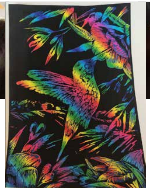
... a tak wygląda gotowe dzieło!