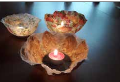
Jak wykonać taki piękny lampion można dowiedzieć się w „Józefince”

pomieszczenia. No, nie tylko ozdabiające, ale ciągle jakby zabierające oglądających je klubowiczów w podróż do przeszłości.