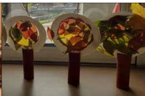
... a te najmłodszy uczestnicy warsztatów „Jesienne kompozycje”