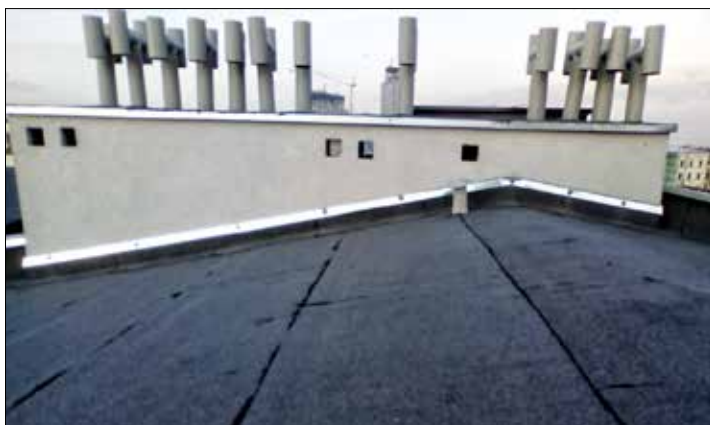
ŚRÓDMIEŚCIE. Ul. Kochanowskiego 1 budynek po kapitalnym remoncie dachów

cm, – malowanie ścian powyżej płytek farbami lateksowymi w kolorze jasnobieżowym, – malowanie drzwi portierni w kolorze płytek – zgodnie z kolorem paska na ścianie (fiolet), – demontaż istniejącego oświetlenia, – demontaż istniejącego sufitu podwieszanego, – montaż sufitu podwie-