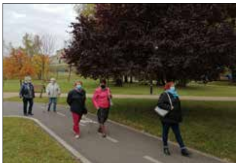
Klubowiczki z „Centrum” łapią odporność na spacerze