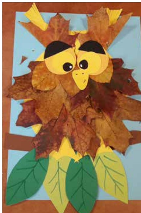
„Józefinka”: jakież cudeńka można zrobić ze zwykłych liści