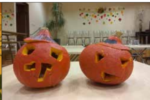
„Trzynastka”: tegoroczny Halloween się nie udał z powodu koronawirusa, ale w dyniach rzeźbiono