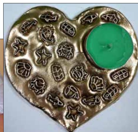
... i efekt końcowy