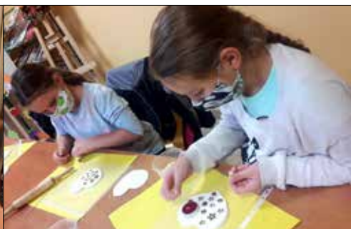
„Józefinka”: praca nad świecznikiem...