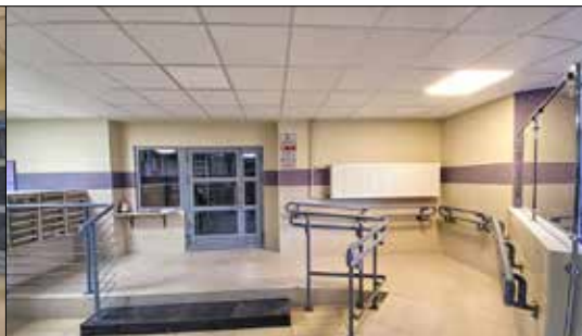
SUPERJEDNOSTKA. Zakończenie remontu holu wejściowego przy ul. Korfatego 24