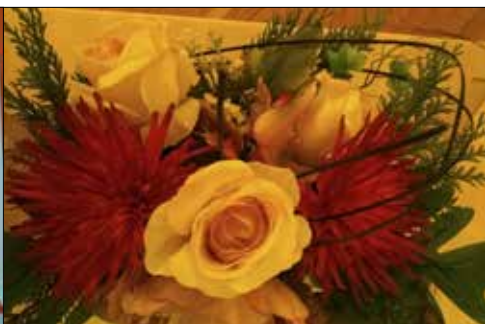
Takie jak ten stroiki robiono na warsztatach w „Trzynastce”