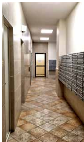
HAPEROWIEC. To najmniejsze i jedynobudynkowe osiedle KSM przy ul. Sokolskiej 33. Dlatego cieszą wyremontowane zewnętrzne schody główne. Po renowacji dobrze prezentuje się hol na parterze wewnątrz tego wysokościowca.

duszu remontowego gromadzonego w Spółdzielni, będącego w dyspozycji każdego z osiedli, a o planie prowadzonych w danym roku robót decydują poszczególne Rady Osiedli.