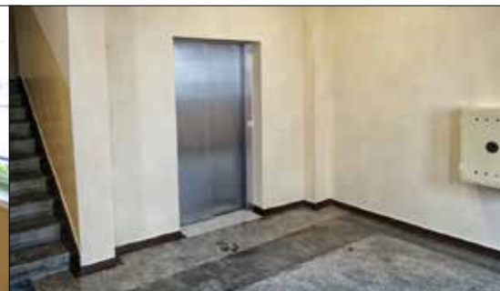
OSIEDLE GRANICZNA. Pięknie odmalowany korytarz i klatka schodowa na I p. przy Francuskiej 70b