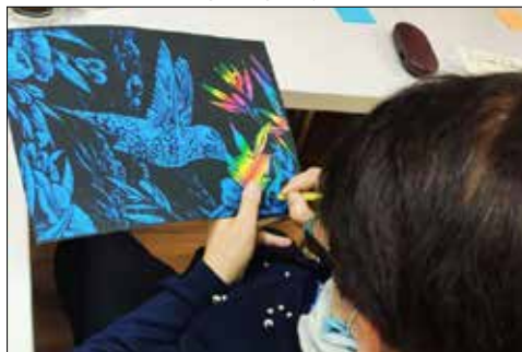
„Juvenia”: tak powstaje obrazek...