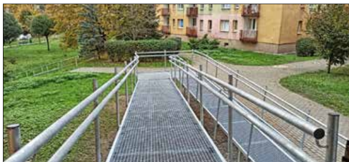
LIGOTA. Przy budynkach przy ulicach Wodospady 6 oraz Ligockiej 70a powstały nowe podjazdy dla osób niepełnosprawnych oraz osób z wózkami dziecięcymi, a także zakupowymi

Koniec lata i początek jesieni przyniosły finał wielu robót. Zastoju i beczynności więc nie było. Wszędzie coś się działo. Prezentujemy niektóre z przedsięwzięć wykonanych w osiedlach. Podkreślić trzeba, że są one realizowane z części „B” fun-