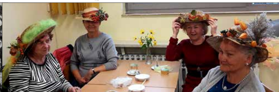
Święto Kapelusza w „Józefince”

Słonko zaglądało przez ramię i podziwiała artystki przy sztalugach.