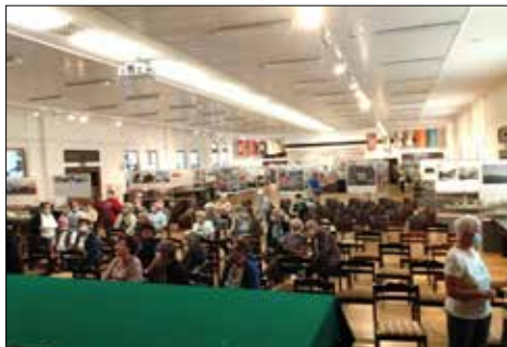
Uczestnicy wczasów KSM w legendarnej sali BHP Stoczni Gdańskiej