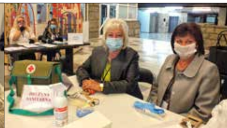
Drużyna Sanitarna była gotowa do ewentualnego niesienia pomocy, co szczęśliwie nie okazało się konieczne