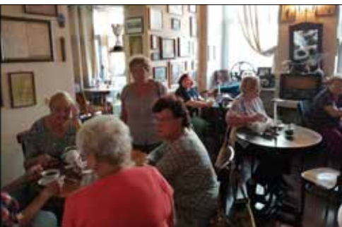
Z „Centrum” do Kawiarenki Cafe Jeruzolima w Będzinie