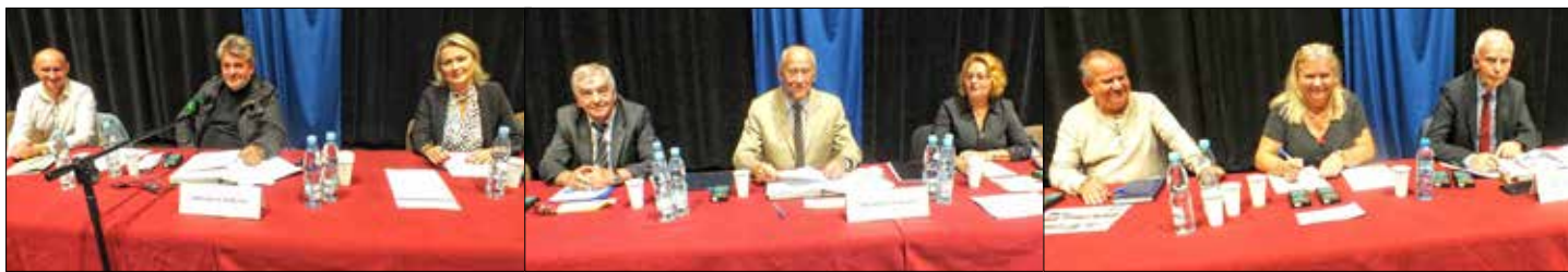
Prezydium Walnego Zgromadzenia z każdej części obrad