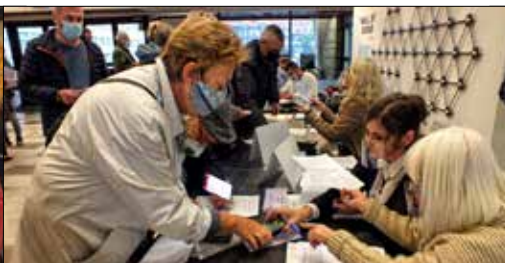
Członkowie Spółdzielni przybyli na Zgromadzenie podpisali listę obecności, odbierali mandaty uczestnictwa oraz elektroniczne piloty do głosowania