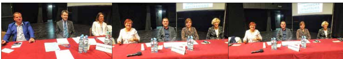
Komisje Wyborcze z każdej części obrad

Następnie przewodniczący obrad przeprowadzali wybory do komisji: