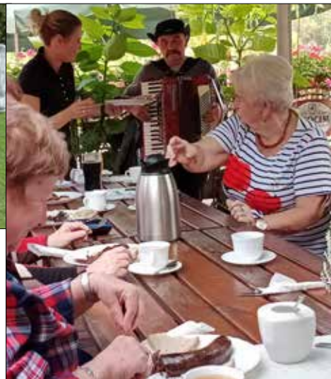
Giszowiec - piknik na terenie Ośrodka Bolina - 100-Krotki i przyjaciele

Wrzesień zazwyczaj był czasem, kiedy kluby wręcz pękały w szwach. Po wakacyjnej przerwie, która wprawdzie nie wyłączała ich z działalności, choćby za sprawą Akcji Lato, seniorzy tłumnie się tu schodzili, stęsknieni swoich spotkań, szerokim strumieniem napływali chętni do udziału w zajęciach sekcji, reaktywowanych po kanikule. Ten wrzesień, jak i cały rok, był szczególnie. Dlatego też pozwolę sobie zacytować słowa Vivian Green, amerykańskiej pianistki i wokalistki zespołu R&B, które, wydaje mi się, warto są tego zwłaszcza dlatego, że piękne i dlatego, że pasują do aktualnej sytuacji. Powiedziała ona mianowicie: „W życiu nie chodzi o czekanie, aż burza minie... Chodzi o to, by nauczyć się tańczyć w deszczu”.