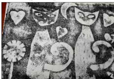
Jeden z obrazów wykonanych na warsztatach w „Józefince”