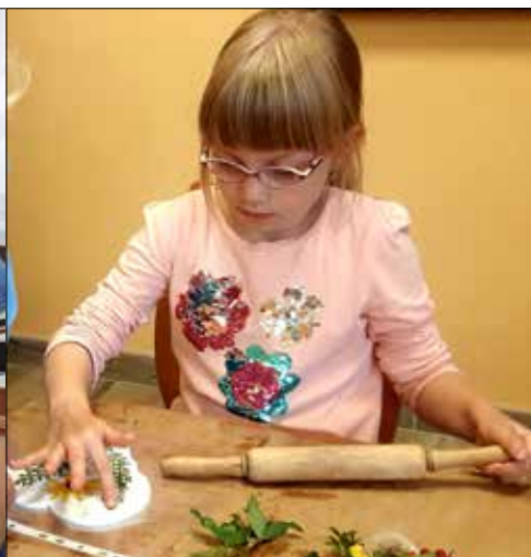
Jak zatrzymać lato - warsztaty w „Józefince”