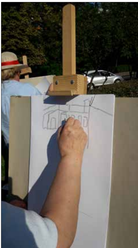
„Józefinka” zorganizowała plener malarsko-rysunkowy

Cztery nasze zespoły śpiewające nie mogły dłużej milczeć. „Centrum” nawet miało swoje „Muzyczne lato”, w ramach którego odbyły się spotkania wznawiające działalność tamtejszych zespołów śpiewaczych „Wesołe Kumoszki” i „Alle