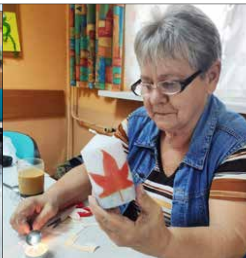
„Pod Gwiazdami”: warsztaty zdobienia świec w klubie Seniora klubu „Juvenia”