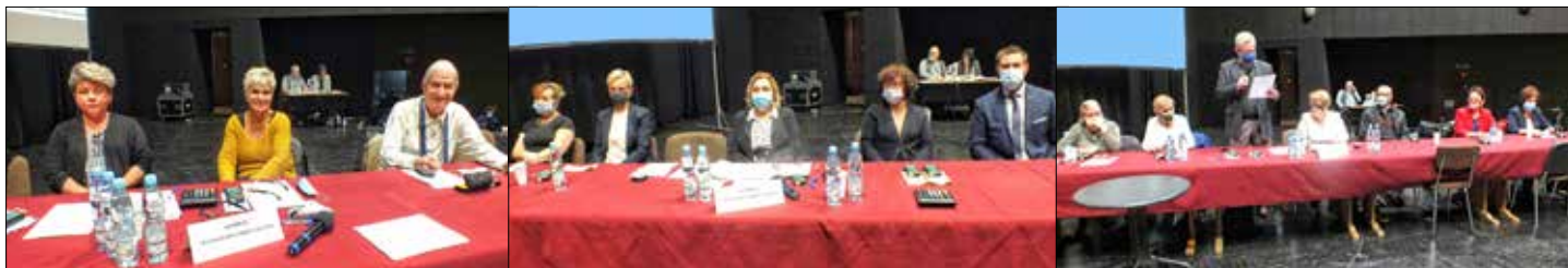
Komisje Mandatowo-Skrutacyjne z każdej części obrad

rze prezydium oraz przewodniczący komisji mandatowo - skrutacyjnych trzech części Walnego Zgromadzenia. Protokół z obrad Kolegium Walnego Zgromadzenia, zawierający ostateczne – to znaczy łączne wyniki głosowań w sprawie uchwał – stanowi zwięźlenie niniejszej relacji na łamach „Wspólnych Spraw” (publikujemy go na str. 8-9), nadto umieszczony jest na stronie internetowej Spółdzielni www.ksm.katowice.pl oraz w całości udostępniony jest do wglądu dla członków Spółdzielni w siedzibie Zarządu Katowickiej Spółdzielni Mieszkaniowej przy ul. Klonowej 35c, w Dziale Organizacji