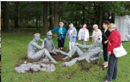
„Centrum”: przy pomniku „Śniadanie na trawie” w Parku Leśnym