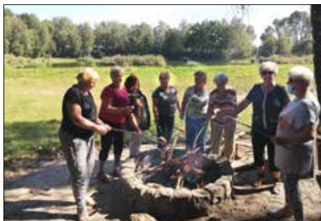
Klubowiczki z „Centrum” pieką kiełbaski w Ośrodku „Rzęsa”

Taki właśnie jesienny klimat wprowadziły do klubu uczestniczki zajęć, ozdabiając słomkowe kapelusze jarzębiną, szyszkami, kolorowymi liśćmi,