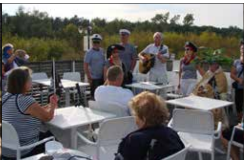
Pirackie śpiewy na nadmorskich wczasach w Trzynastkowiczów