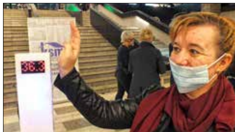
Przy wchodzeniu do gmachu „Katowice Miasto Ogrodów - Inst. Kultury im. Krystyny Bochenek”, w którym odbywało się Walne Zgromadzenie, każdy poddawał się zmierzaniu temperatury