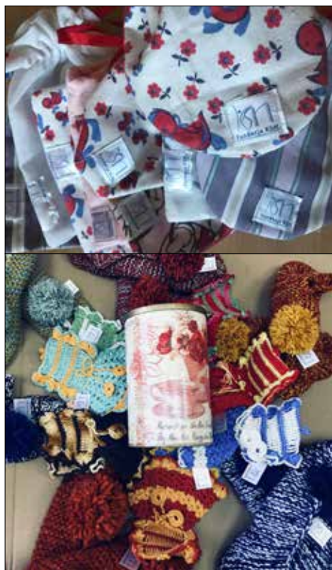
Rękodzieła naszych wolontariuszy mogą być miłymi upominkami

Spośród osób, które udzielił poprawnych odpowiedzi na obydwa pytania wylosujemy dwie, które otrzymają pamiątkowe upominki. Odpowiedzi prosimy przysyłać mailowo na adres: fundacja@ksm.katowice.pl bądź listownie na adres: Fundacja KSM, 40-168 Katowice, ul. Klonowa 35c.