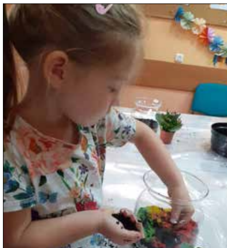
Warsztaty dla dzieci „Las w słoiku” dla klubów „Juvenia” i „Pod Gwiazdami”

naszego, pięknego Bałtyku. Wzorem bowiem roku ubiegłego, Dział (we współpracy z BT „Altamira” zorganizował 13-dniowy turnus wypoczynkowy we Władysławowie dla seniorów zamieszkujących zasoby Katowickiej Spółdzielni Mieszkaniowej. W wypoczynku w pierwszej połowie września uczestniczyło 31 osób. Mimo, że pogoda była nie tylko słoneczna, ale i kapryśna, nasi mieszkańcy aktywnie zwiedzali Kaszuby Północne i wypoczywali na władysławowskiej plaży, liczącej 3 km długości oraz 55 m szerokości. Zawitali między innymi do Gdańska, na Półwysep Helski, do Pucka, Swarzewa, Jastrzębiej Góry, na Przylądek Rozewie. Niestrudzenie i ochoczo uczestniczyli