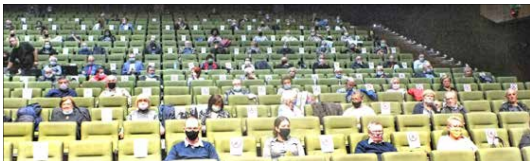
Obrady Walnego Zgromadzenia odbywały się z zachowaniem przez uczestników obowiązującego dystansu społecznego