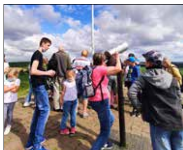
Czego Gwiazdowicze i klubowicze z „Juwenii” wypatrywali na niebie w biały dzień w Radzionkowskim Ogrodzie Botanicznym?

12-16 z (niektórych tylko!) imprez. tylko żałować. Lato'2020 już za Kto w nich uczestniczył - ma co nam. Startujemy do całorocznych wspominać, a kto nie - może już spotkań w klubach.