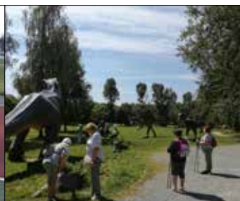
Młodzi duchem seniorzy z klubu „Centrum” wśród prawdziwych dinozaurów w siemianowickim ośrodku „Rzesa”