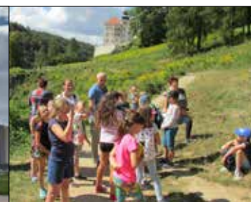
Giszowanie opodal zamku w Pieskowej Skale