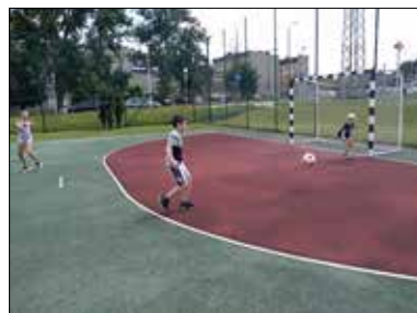
Turniej piłkarski Trzynastkowiczów. No i co, był gol - czy nie?