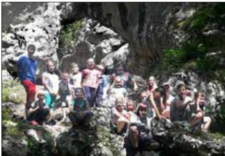
Dzieci z Giszowca na Jurze Krakowsko-Częstochowskiej