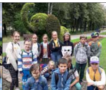
Pamiętacie piosenkę o czterech zielonych stoniach? Jednego na swej wędrowce spotkały dzieci z „Józefinki”