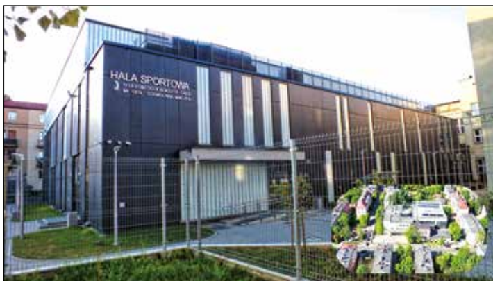
Hala Sportowa schowana jest za budynkiem IV Liceum

– W 2019 roku nowelizacja Ustawy o samorządzie gminnym uczyniła Budżety Obywatelskie narzędziem obligatoryjnym dla miast wojewódzkich. Choć Budżet Obywatelski wdrażaliśmy w Katowicach jako jedno z pierwszych miast w Polsce, byliśmy zmuszeni dostosować regulacje do nowych przepisów, w tym również do Ustawy z dnia 20 lipca 2018 r. o przekształceniu prawa użytkowania