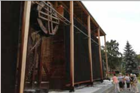
„Centrum” szlakiem tężni odwiedziło chorzowski Park Hutników