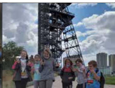
Z Zawodzia do Muzeum Śląskiego niewiele kroków, a atrakcji multum