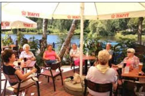
Odpozynek seniorów z „Centrum” w Rybaczówce