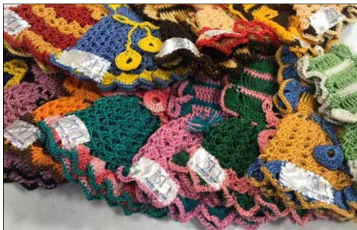
Takie cudowniki przekazały wolontariuszki jako cegiełki w zbiorce prowadzonej przez Fundację KSM

fakt, że lista SPRZYMIERZENIÓW programu stale się powiększa.