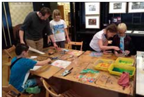
Warsztaty plastyczne Trzynastkowiczów

Sześć klubów osiedlowych ma KSM, a w każdym – po raz kolejny się o tym przekonacie – realizowano super-pomysły wyjątkowe, inne, niż w pozostałych placówkach i na dodatek było ich wiele. Tytuł tej części relacji klubowej związany jest właśnie z jednym z takich wydarzeń, czyli z poznawaniem pracy copywritera – twórcy tekstów i haseł reklamowych. Dzieci wcieliły się w jego rolę i po twórczej „burzy mózgów” powstało hasło: „ Wszystkie dzieci z „Józefinki” mają wesole minki ”. A skoro o śmiechu mowa, w drugiej części zajęć, dzieci rysowały zabawne portrety z zasłoniętymi oczami, kierując się tylko