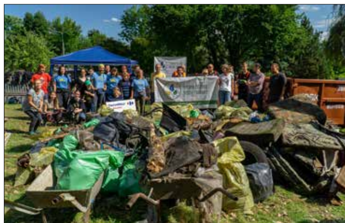
Dzięki pracy uczestników akcji SprzątaMY Dzielnicę te śmieci już nie szpecą naszego miasta

nęło ponad 40 propozycji miejsc, w których Katowiczanie chcieliby widzieć akcję sprzątnięcia. Wybrano te, na które najwięcej oddano głosów w mediach społecznościowych.