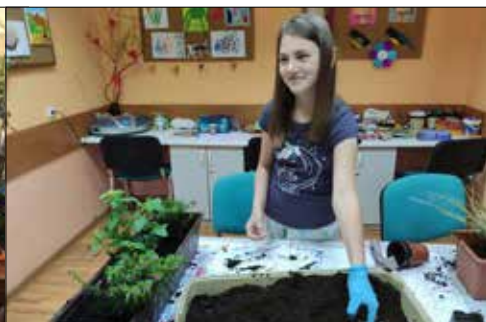
Warsztaty botaniczne dla klubowiczów spod „Gwiazd” i z „Juwenuii”