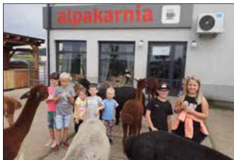
Bezpośredni kontakt ze zwierzętami był wielką atrakcją na wspólnej wycieczce klubowiczów z Juwenii i Gwiazd