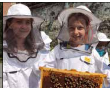
Na wspólnej wyprawie dzieci z „Juwenii” i Gwiazd zaprzyjaźniły się z ...pszczołami