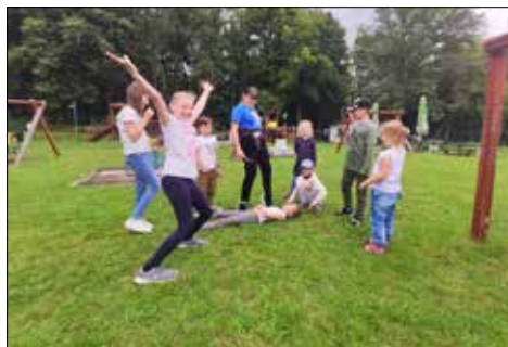
Dzieci z „Gwiazd” i „Juwenii” odwiedziły Ogród Botaniczny w Radzionkowie

Interesujące zajęcia odbyły się w gmachu instytucji Katowice Miasto Ogrodów. Dzieci uczyły się co to jest rytm, jak tworzyć muzykę, próbowały