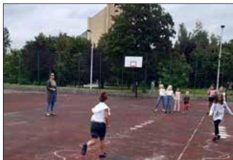
GCK: zabawy na boisku