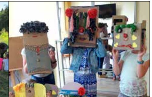
Józefinkowe stworki - potworki

towarzyszy nam kiedy patrzemy w przebijające się przez gałęzie drzew słońce, a które Japończycy określają słowem komorebi. Myślę, że uczestnicy realizowanego przez GCK bloku imprezowego nie narzekali na brak ruchu, ponieważ staraliśmy się codziennie sporo czasu spędzać aktywnie na świeżym powietrzu. W tej dziedzinie nasi instruktorzy także wykazali się dużą kreatywnością.