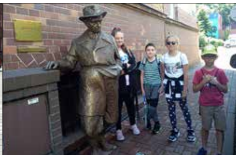
Trzynastkowicze przed wejściem do MHK uwiecznili się na fotografii wraz ze sławnym WITKACYM