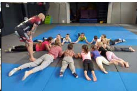
Zgadnijcie czy milusińscy z „Juwenuii” i „Gwiazd” uniosą się w powietrze...?