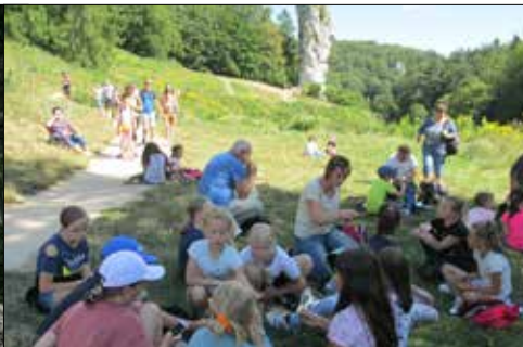
Jaka szkoda, że Maczuga Herkulesa można tylko oglądać, a nie wolno wspiąć się na nią?