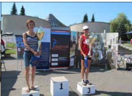
Najszybsze biegaczki spośród 26 uczestniczek