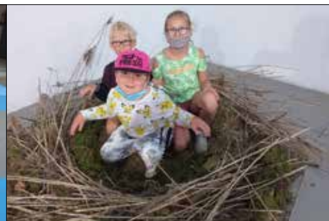
Trzynastkowicze w bocianim gnieździe