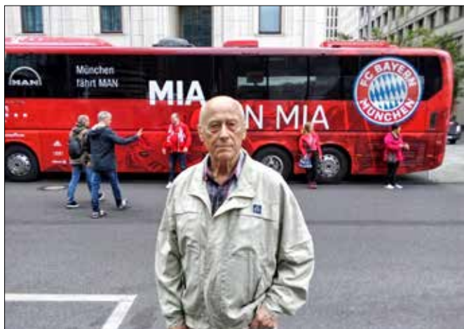
Trzeba szczególnego trafil, by podczas wycieczki do Berlina uwiecznić się na tle autokaru z kibicami Bayernu München, którzy też przyjechali zwiedzać niemiecką stolicę