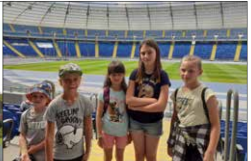
Dzieciaki z „Gwiazd” i „Juwenii” zawędrowały na Stadion Śląski