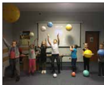
To nie zwykłe piłki - to planety w rękach młodych Giszowian