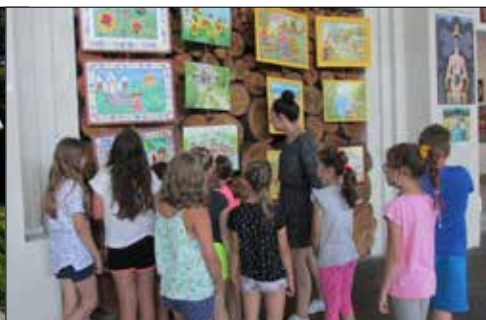
Dzieci z GCK w Galerii Szyb Wilson

S twierdzą krótko: jestem pod wrażeniem! Wzbudza ją kreatywność pań prowadzących kluby osiedlowe Katowickiej Spółdzielni Mieszkaniowej oraz instruktorów zajęć. W wakacje, naznaczone piętnem koronawirusa, a tym samym wciśnięte w ramy wielu niezbędnych ograniczeń, udało im się przygotować dla najmłodszych taki program, który był i ciekawy, i mądry, i wesoły, i urzekający pięknem. Na dodatek często wszystko to „skrojone” było na możliwości, jakie dawało najbliższe otoczenie.