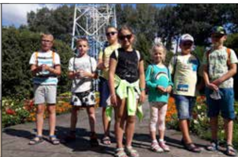
Dzieciaki z „Józefinki” w Parku Kościuszki pod Wieżą Spadochronową