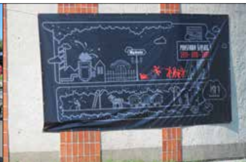
Plakat upamiętniający rocznice trzech powstań śląskich

Śląskiego, które rozpoczęło się w nocy z 19 na 20 sierpnia 1920 roku.