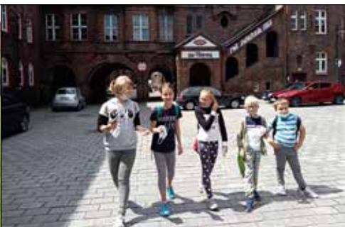
Czy wyprawa z Zawodzia na Nikiszowiec może być atrakcją? Okazuje się, że tak!