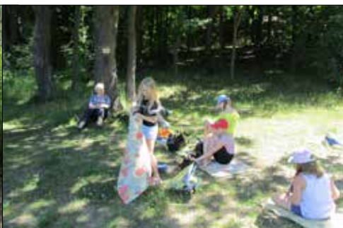
Piknik giszowian w Ośrodku Janina-Barbara