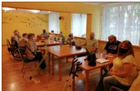
W klubie „Centrum” wznowione zostały także spotkania osób z niepełnosprawnością ruchu