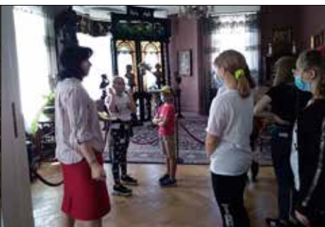
Trzynastkowicze w MHK poznawali wnętrza mieszczkańskiej kamienicy