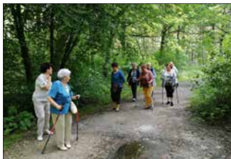
Klubowiczki z „Centrum” na pierwszym wspólnym spacerze