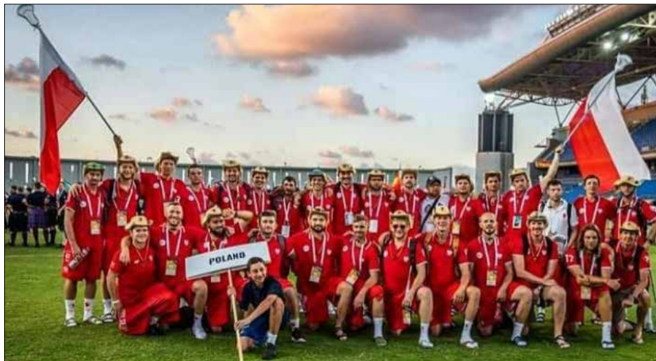
Polska reprezentacja w Lacrosse

Takie dyscypliny sportowe jak rugby czy futbol amerykański zawsze mnie pasjonowały. Rugby to zespołowa gra między dwoma piętnastoosobowymi drużynami. Polega na podawaniu owalnej piłki ręką lub nogą. Trzeba uważać, aby nie podawać piłki ręką do przodu, to jest zabronione.