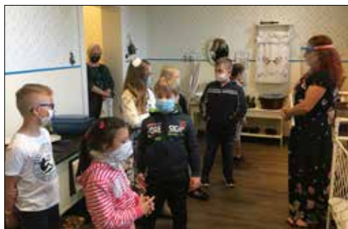
Odwiedziny w Muzeum Historii Katowic przy ul. Rymarskiej