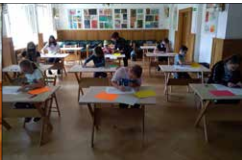
Zajęcia plastyczne młodych zawodzian