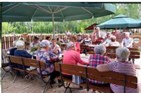
Plenerowe spotkanie starszych klubowiczów z „Trzynastki” w ośrodku Bolina

W iosenne zamknięcie w mieszkaniach (lockdown) dało się nam wszystkim we znaki i na dodatek pozostawiło w nas – patetycznie mówiąc – niezatarte piętno. Mimo więc, że wydano zgodę na wychodzenie z domu, że zdejmowane są kolejne obostrzenia – wiele osób obawia się korzystania z większej swobody. Nie jest to zresztą lęk nieuzasadniony, jeśli weźmiemy pod uwagę fakt, że koronawirus ciągle jest rozpoznawany i w wyniku kolejnych etapów jego poznania, zmianie ulegają sugestie dotyczące bezpiecznych zachowań. W tej sytuacji nasze „odmrożone” spółdzielcze kluby, mając już odpowiednio wcześniej przygotowane plany działania, nie mogły jeszcze w pełni rozwinąć skrzydeł, choć nie oznacza to, że było w nich pusto, cicho i nudno.