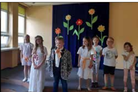
Zajęcia literacko-teatralne w Giszowieckim Centrum Kultury

w różnorodnych warsztatach plastycznych, grach logicznych, uczyli się tworzyć wspaniałe fotokolaże. Potem ich prace dumnie zdobiły okna w klubie.