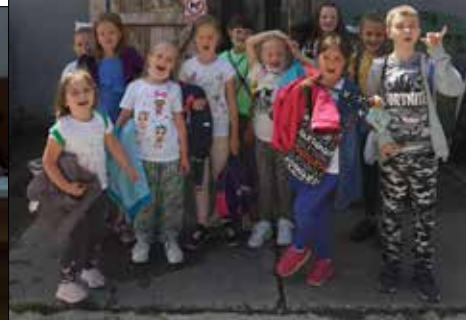
Wizyta w Papugarni podobała się gwiazdowiczom