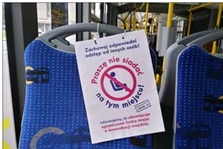
W środkach komunikacji miejskiej nadal można korzystać tylko z części miejsc

Wizualnym znakiem ostrzegawczym, przypominającym o zagrożeniu koronawirusem, z jakim stykają się wszyscy korzystający z komunikacji masowej, są wywieszane na siedzeniach tabliczki informacyjne z napisem: „Proszę nie siadać na tym miejscu”. W każdym autobusie i tramwaju obowiązuje ograniczona ilość dostępnych miejsc. I będziemy to ostrzeżenie oglądać każdego dnia aż do zniesienia stanu epidemii.