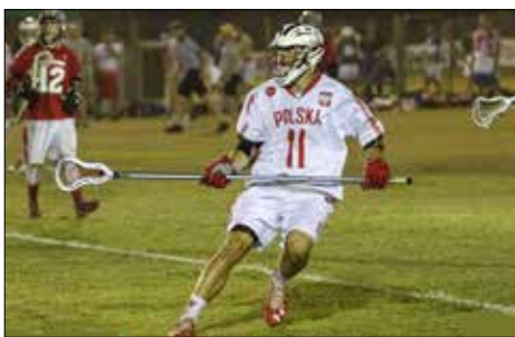
W trakcie meczu

Wracając jeszcze do AZS Legion Katowice. W sezonie 2014/2015 zdobyliśmy srebrny medal, tylko niestety w drugiej lidze. Natomiast w sezonie