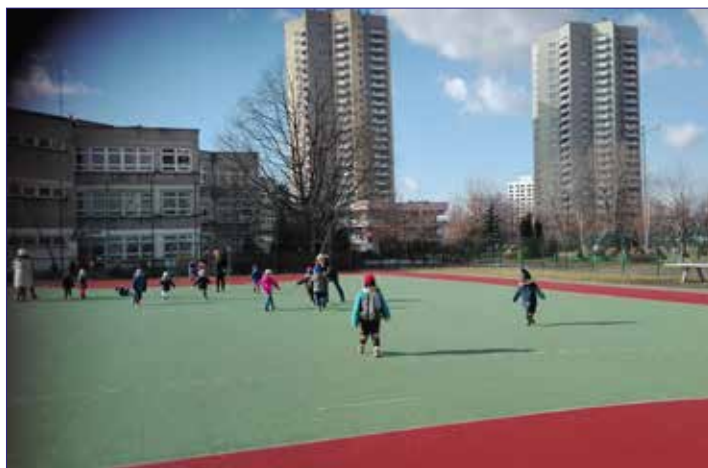
Ciepła zima pozwalała na zabawy na boisku

Ambasadorami idei integracji dzieci stają się już w przedszkolu. Choć nie operują jeszcze wyszu-