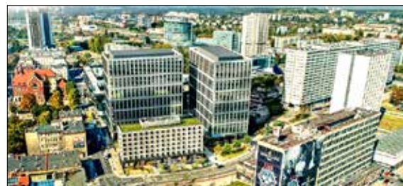
Nova Silesia obok Superjednostki

Inwestorem jest Firma Vastint Poland, która zapowiada, że pomiędzy budynkami zachowa swobodne przejście i stworzy tu plac, tak by Nova Silesia nie była zamkniętą enklawą w środku miasta. 70 proc. powierzchni na parterach budynków będzie przeznaczona na usługi. W hotelu ma to być strefa spotkań oraz otwarty przez całą dobę bar. Pod biurowcami będzie dwupoziomowy parking, z którego (w weekendy) będą mogli korzystać wszyscy chętni, a nie tylko pracownicy.