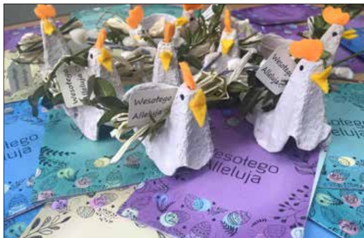
Masz wytłoczek po jajkach - zrób ozdoby świąteczne

Pamiętajmy, że wszystkie działania zmierzające do odpowiedniej segregacji wpływają na ochronę środowiska, dzięki czemu kolejne pokolenia będą mogły żyć w zdrowszych warunkach na czystej i zielonej planecie.