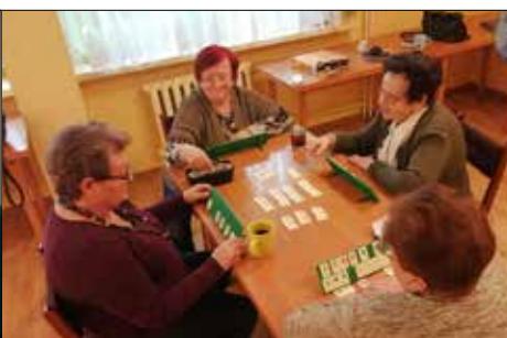
Karciane rozgrywki to stały sposób na niepogodę w klubie „Centrum”