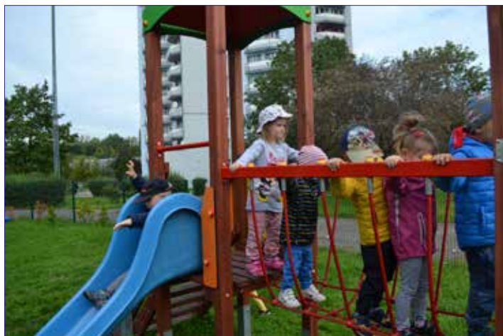
Na osiedlowym placu zabaw

Artystyczne Festiwale Integracyjne, które liczą już VII odsłon