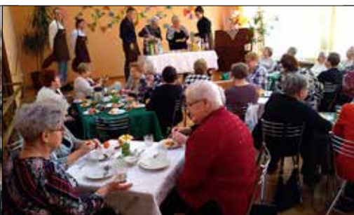
„Trzynastka”: kolorowy zawrót głowy