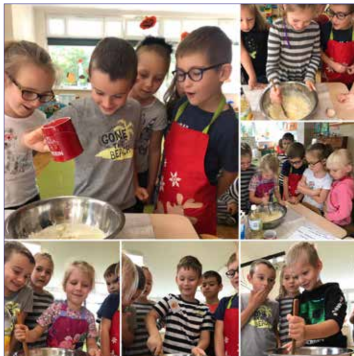
To i zabawa i nauka - czyli jak robi się ciasto

łymi bywalcami placów zabaw, boiska, aktywnie spędzają czas na zewnątrz budynku. Organizacja wyjść i spacerów odbywa się w oparciu o dane z monitoringu stanu powietrza.