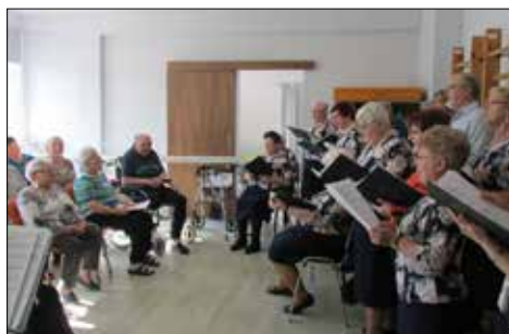
Występ Zespołu „100-Krotki” w Ośrodku Dziennego Pobytu DEDOM dla osób starszych