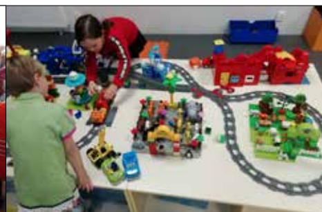
Dzieci z „JUVENII” odwiedziły Kreatywne Centrum Zabaw 1000 klocków

T ytuł dzisiejszej relacji (właściwie słowo „relacja”, to nieco określenie na wyrost) jest parafrazą powieści Gabriela Garcíi Márqueza ( Miłość w czasach zarazy - El amor en los tiempos del cólera ), powieści o miłości, która okazuje się silniejsza od samotności, od fatum. To nawiązanie oczywiście należy traktować toutes proportions gardées, ale uwierzcie Państwo: nie jest zupełnie bezzasadne, gdyż czas – wywołany koniecznością odosobnienia z powodu epidemii – bardzo wyraźnie pokazał, jak niezwykle ważne i cenne, szczególnie dla seniorów, jest istnienie klubów prowadzonych przez Katowicką Spółdzielnię Mieszkaniową.