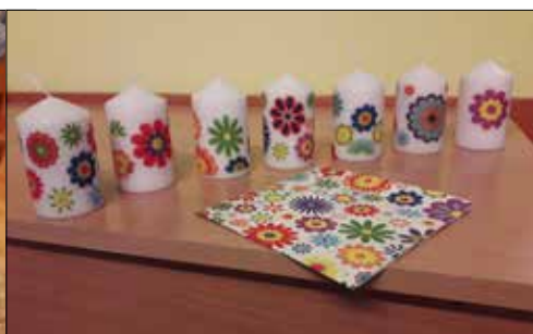
„Pod Gwiazdami”: piękny plon warsztatów decoupage'u dla dorosłych

Miłoszewski, który czytał swoją książkę.