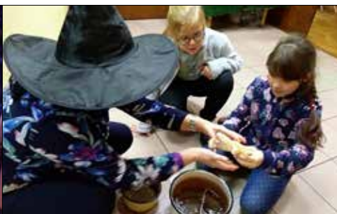
„Trzynastka”: wieczór wróżb andrzejkowych dla dzieci