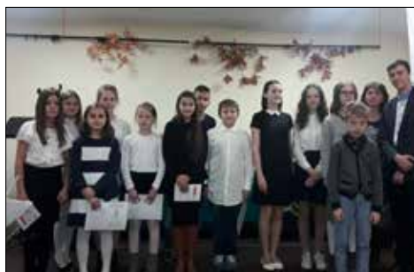
Artystyczna młodzież zachwyciła bywalców „Józefinki”

Także nasze inne, klubowe zespoły wzięły udział w Przeglądzie Artystycznym w Tarnowskich Górach. Mowa o wełnowieckich