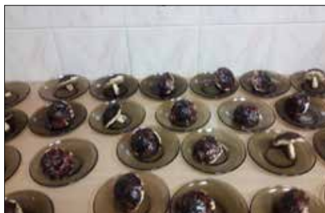
Słodkie grzybki made in Józefinka - w dodatku każdy z niespodzianką w środku

23 listopada natomiast odwiedzono zażytkową Kopalnię Srebra w Tarnowskich Górach, gdzie znajduje się jedyna w Polsce podziemna trasa turystyczna, umożliwiająca zwiedzanie podziemi dawnej kopalni kruszców srebrnonośnych. Obiekt wraz ze sztolnią „Czarnego Pstrąga” w 2017 r. został wpisany na listę Światowego Dziedzictwa UNESCO. Finałem tej wycieczki były Pławniowice, gdzie zwiedzano malowniczą perełkę architektoniczną - zespół pałacowo-parkowy z końca XIX w. Do stycznia 1945 r. dobra pławniowickie pozostawały w rękach rodziny Ballestrem, która Pławniowice obrała sobie za swą rodową siedzibę, wznosząc tu