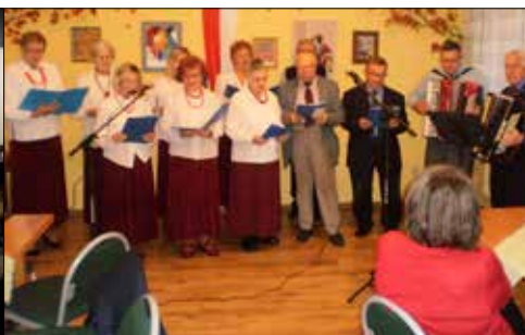
Klub „Centrum”: występ zespołów „Alle Babki” (z prawej) i „Wesołe Kumoszki” (z lewej) z okazji Święta Niepodległości