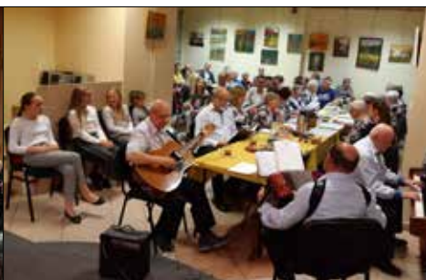
GCK: międzypokoleniowy wieczór pieśni patriotycznych

Tańce, uzupełniły rozrywki umysłowe, które są znakomitą formą ćwiczeń mózgu. Rywalizacja w grach logiczno-strategicznych zawsze dostarcza mnóstwo emocji, usprawnia myślenie, koncentrację i pamięć. Chętnie z tej propozycji korzystali bywalcy klubu na Koszutce.