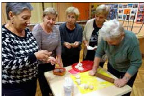
Wieczór gruzińsko-armeński - lepienie pierogów w „Trzynastce”