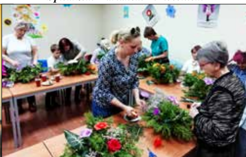
„Juwenia”: zajęcia florystyczne