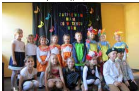
„Zaśpiewam wam, co w sercu mam” - finał konkursu dla dzieci przedszkolnych w GCK