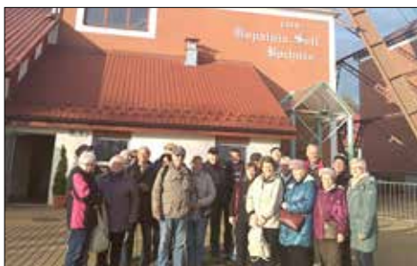
„Trzynastka”: wycieczka do Kopalni Soli Niepołomice

Oczekiwana, listopadową okazją do zabawy i dreszczyku tajemniczości są Andrzejki. Ze