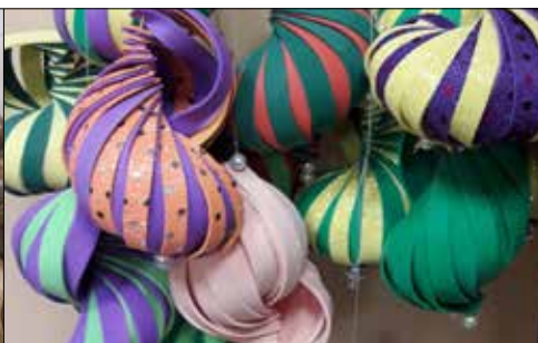
Takie cacka choinkowe powstają na warsztatach w „Józefince”