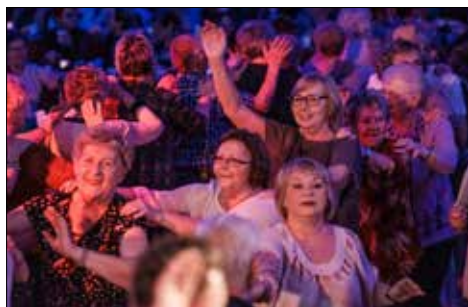
Radosne Andrzeжки w „Juwenii”