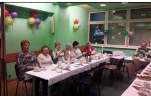
Seniorzy z „Józefinki” zawitali do klubu „Pod Gwiazdami”