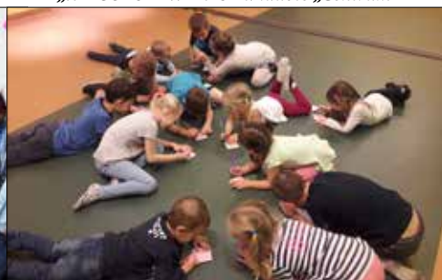
„Pod Gwiazdami”: dzieci rysują swoje marzenia

Oczywiście wypad do pięknego, urokliwego o każdej porze roku Wrocławia nie mógł się ograniczyć tylko do podziwiania sławnego płótna. Klubowicze pospacerowali po mieście. Zaczęli od miejsca związanego z historią Polski, a mianowicie od Pomnika Ofiar Katynia. Potem przeszli bulwarem nad Odrą na Ostrów Tumski i przez most Zakochanych na Rynek. Po drodze „spotykali” krasnoludki, które wrosły w krajobraz Wrocławia i rozsławiają miasto. Sympatyczny przewodnik bardzo ciekawie opowiadał wycieczkowiczom historię miasta ubarwiając ją anegdotkami.