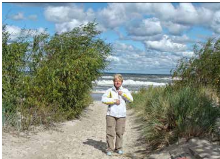
... i nadmorskie krajobrazy

nać się. Ja szczerze mówiąc wolę dolinki, ale 2 lata temu „zaliczyłam” grań od Kasprowego do Doliny Kondratowej oraz Morskie Oko z Czarnym Stawem nad nim.