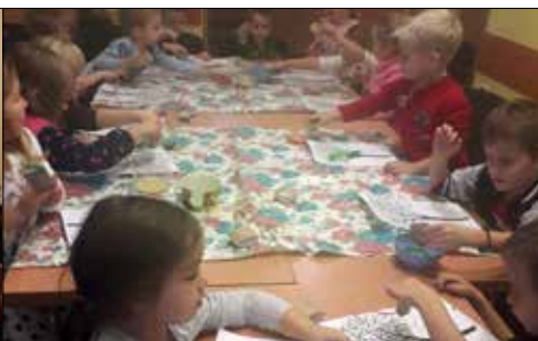
„Pod Gwiazdami”: przedszkolaki podczas warsztatów plastyczno-ruchowych „jesienne inspiracje”

„Trzynastka” też u siebie zorganizowała zajęcia warsztatowe, na których uczestnicy