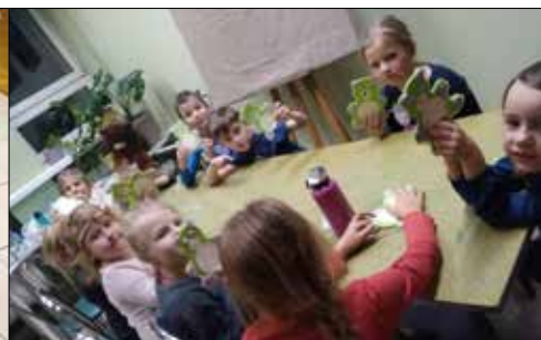
Dzień Misia na Giszowcu

L istopad to miesiąc, zarówno z uwagi na specyfikę panującej wtedy aury, jak i przypadających w jego czasie świąt, skłaniający do powagi i zadumy. Taki też nastrój zagościł w naszych spółdzielczych klubach, chociaż oczywiście zawsze panująca tu energia, optymizm i uśmiech niezupełnie schowały się w minionym miesiącu w kącie. O czasach minionych pamiętamy i świętujemy wielkie rocznice.