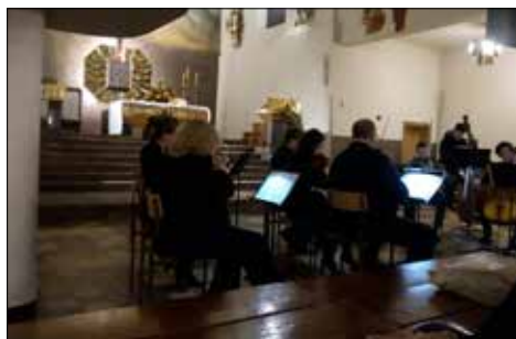
Koncert „Pro Memoria” w kościele na Zawodziu

Tymczasem Klub „Juwenia” wielką rocznicę odzyskania przez Polskę niepodległości obchodził w swoim stylu. Na początku listopada zorganizowano mianowicie konkurs plastyczny dla dzieci „Ukochany kolor biało-czerwony”, podkreślając, że to kolor poświęcenia, walki i wolności – to kolor każdego Polaka. – Nasze dzieci ochnocho przystąpiły do pracy. Dominowały wizerunki orła (godła) wykonywane w różnych technikach plastycznych, flagi polskiej oraz kotylionów. Na zwycięstwo zasłużyły dzieci