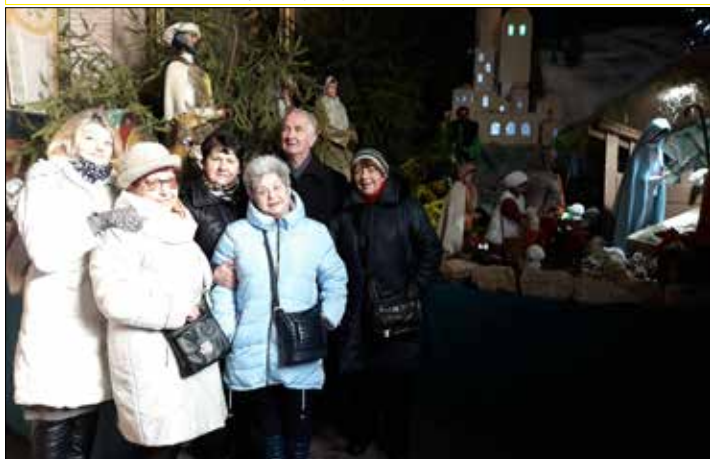
Z „Józefinki” do Szopki Bożonarodzeniowej w Piekarach Śląskich

B ajkowy grudzień minął, pozostawiając żal, że wszystkie te cudowności, które w owym miesiącu są naszym udziałem, przeminęły. Za to Nowy Rok przynosi nam – jak mówi przysłowie – dnia na barani skok. A to musi w nas budzić przeczcucie wiosny, a to przecież także czarowny czas, więc tęsknota za ustrójoną choinką powoli ustępuje tej, za drzewami owianymi delikatną, zieloną mgiełką, młodziutkich listków, albo obsypanych białym kwieciem, chociaż tak naprawdę to właśnie białe – śnieżne – płatki ziemię właśnie obsypały i to obficie. Zanim jednak z niecierpliwością będziemy wypatrywać pierwszych pączków, jeszcze w styczniu delectowaliśmy się atmosferą minionych świąt oraz karnawałowymi błyskami.