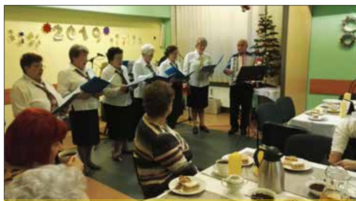
„Alle Babki” w „Gwiazdach” swoim śpiewem rozchmurzyły każdego