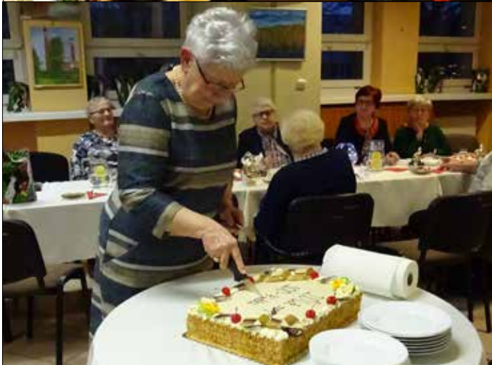
„GCK”: obchody 20-lecia zespołu „100-Krotki”