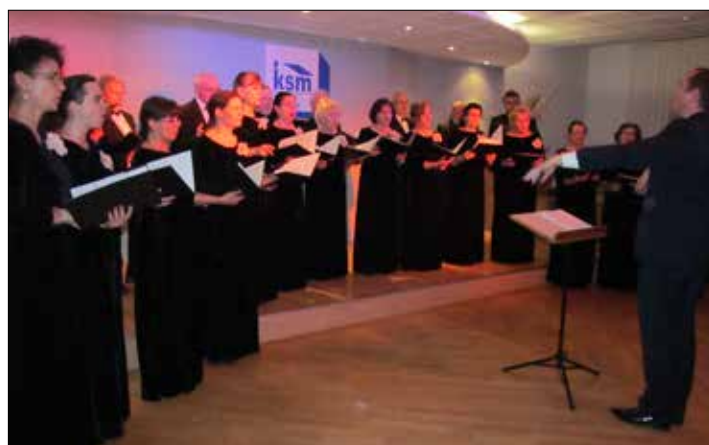
Chór Mieszany „Ogniwo” podczas występu w siedzibie Katowickiej Spółdzielni Mieszkaniowej