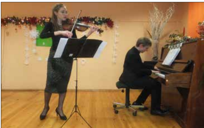
Spotkanie noworoczne w „Trzynastce”