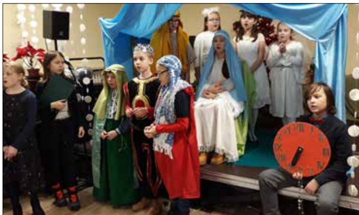
„Józefinka”: jasełka w wykonaniu uczniów Szkoły Podstawowej nr 17