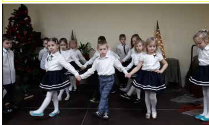
Dzień Babci i Dziadka – występ dzieci z Przedszkola Miejskiego nr 82 w „Józefince”