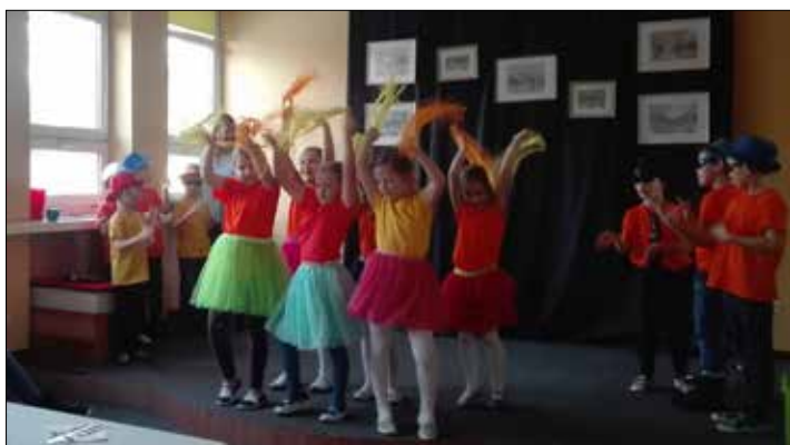
Spotkanie noworoczno-karnawałowe mieszkańców osiedla Giszowiec