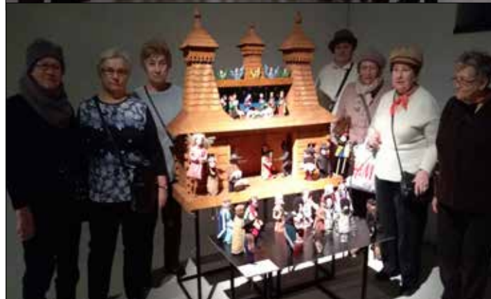
Trzynastkowicze w Muzeum Śląskim na wystawie szopek