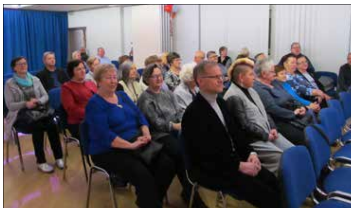
Sluchacze kolędowo-noworocznego koncertu