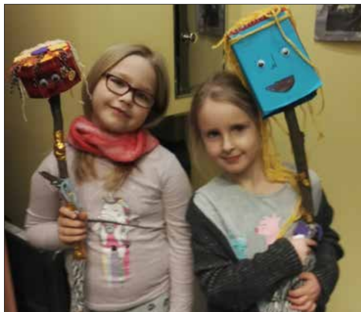
„Pod Gwiazdami”: podczas zajęć plastycznych dzieci przygotowują swoje lale