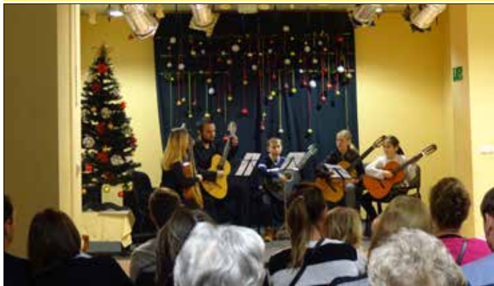
Giszowieckie Centrum Kultury: Hej kołęda kołęda – koncert uczestników sekcji muzycznych i instruktorów