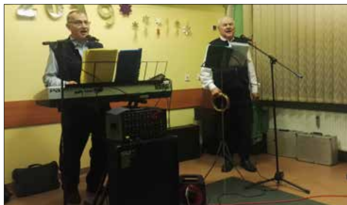
„Pod Gwiazdami”: bo Nowy Rok należy zacząć z przytupem...