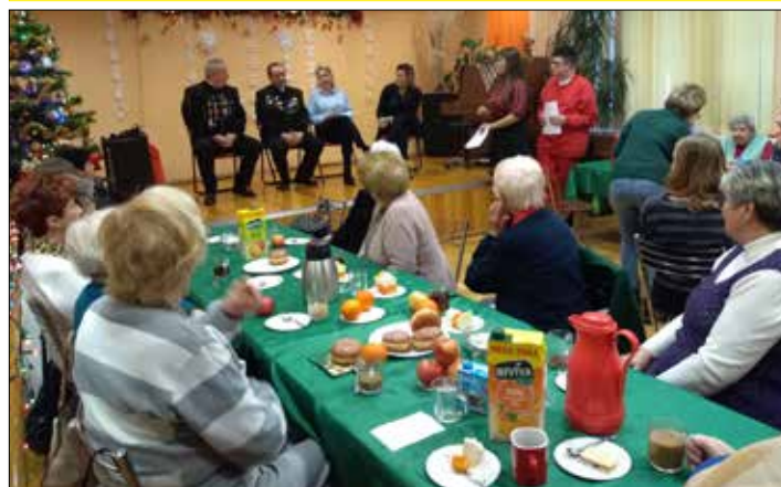
Dla Babć i Dziadków w „Trzynastce”