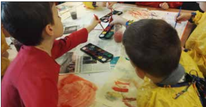
Przedszkolaki w „Gwiazdach” w twórczym zapale...